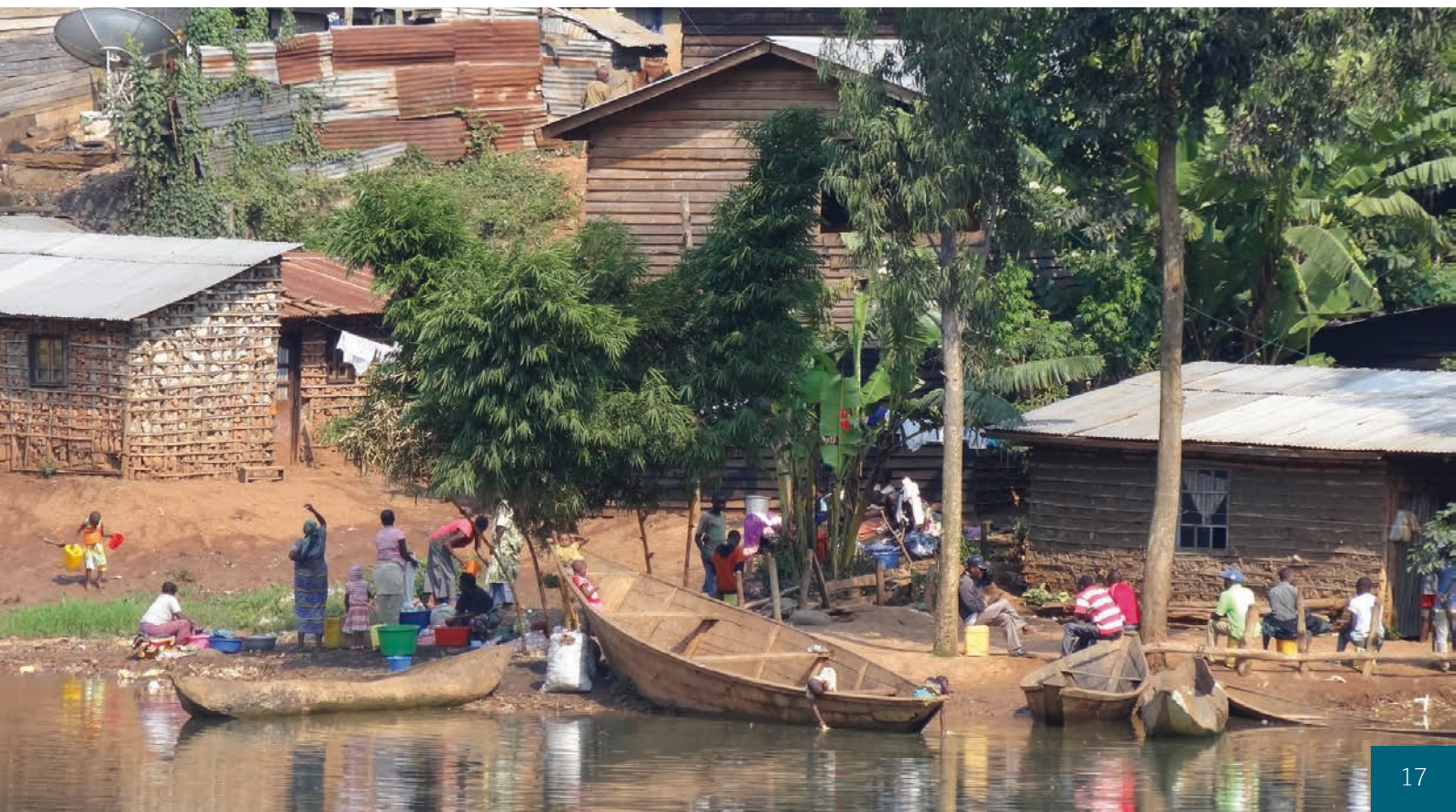
Konžská vesnice u jezera Kivu [2]