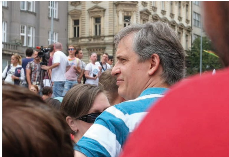
Jiří Dienstbier na Prague Pride v roce 2016 [5]

Kam až může zajít další přirostování české migrační politiky? Nedávná prohlášení Tomáše Haišmana, ředitele Odboru azylové a migrační politi-