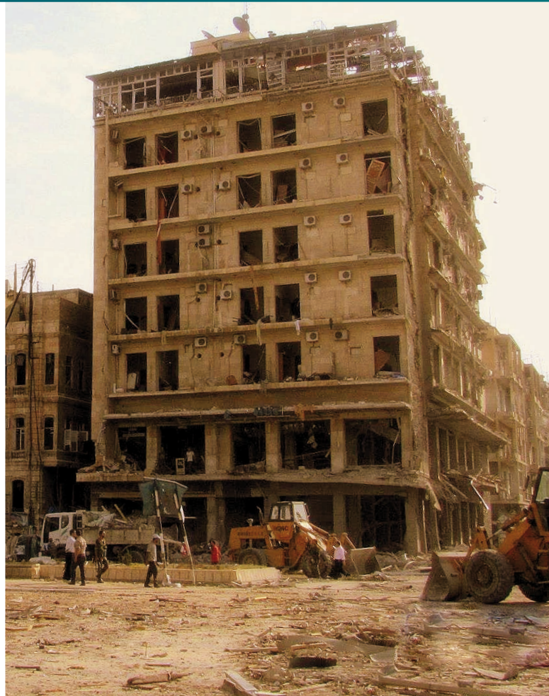
Škody po bombovém útoku v Aleppu [1]

Obyvatelé Sýrie jsou každý den vystavováni nebezpečí ze všech stran. Nezávislá mezinárodní vyšetřovací komise pro Syřskou republiku byla založena v srpnu 2011 Radou OSN pro lidská práva prostřednictvím přijetí rezoluce S-17/1 za účelem vyšetřování údajného porušování mezinárodního práva v lidskoprávní oblasti a zjišťování faktů a zločinů, které směřují k porušení lidských práv. Vyšetřovací komise získala z 621 rozhovorů, které byly realizovány od března 2011 do listopadu 2015, informace o nakládání se zadrženými osobami. Výpovědi podali jak spoluvězni, rodinní příslušníci, tak i pracovníci věznic zřízených vládou.