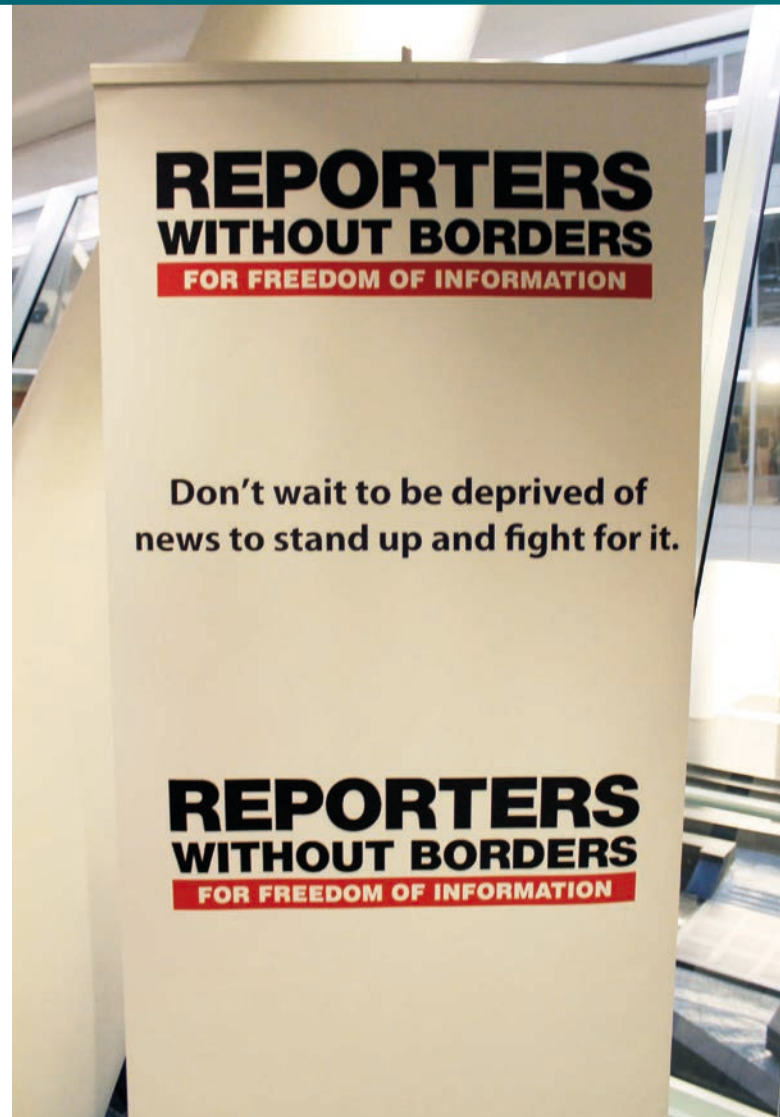
Reportéři bez hranic [1]

Po rozkliknutí každé ikony se čtenář může dozvědět, kdy se dotyčná osoba stala „predátorem“, jakou techniku útoku používá, kdo vykonává její rozka-