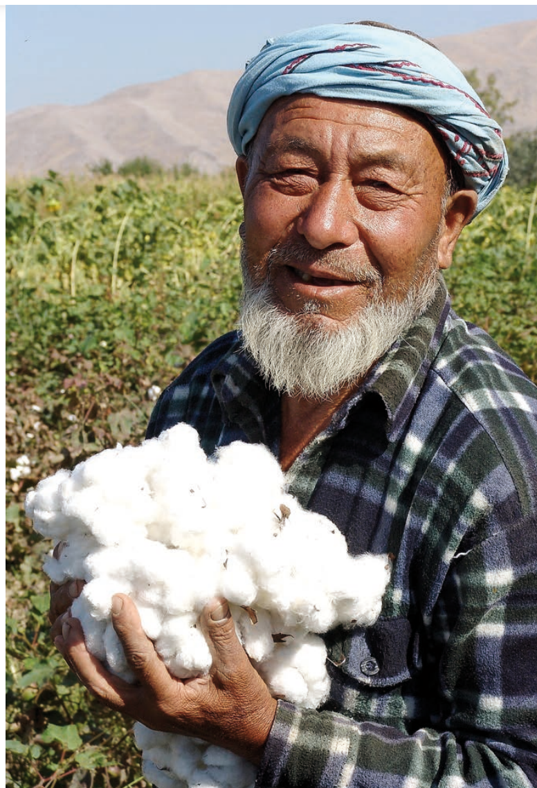
Uzbekistánský sběrač bavlny [1]

Právě lidskoprávní organizace v čele s Human Rights Watch apelovaly na Výbor Evropského par-