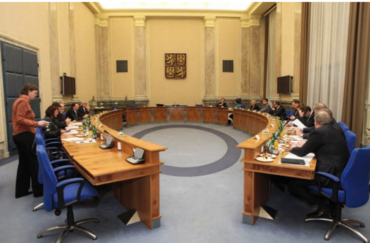
Jednací sál vlády [2]

Jsou ale také záležitosti, které velmi významně vážnou, a kde se projevuje zmíněná nepříznivá atmosféra ve společnosti i mezi politiky. To je například novela zákona o veřejném ochránci práv, v Poslanecké sněmovně je stále zcela neprůchodná část této novely týkající se antidiskriminační žaloby ve veřejném zájmu. To je dáno odporem k určitému způsobu uvažování, který má chránit právě ty nejslabší lidi ve společnosti, kteří často nemají prostředky, jak se bránit, a nemyslím pouze prostředky finanční, ale také např. dostatečnou sociální kompetenci.