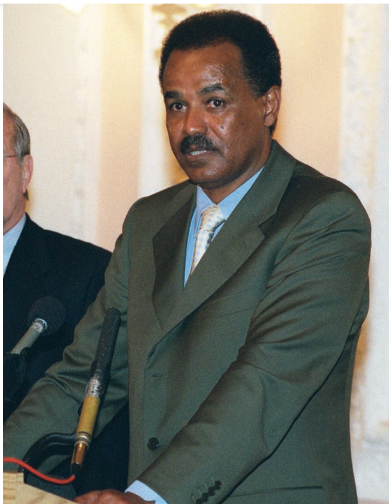
Isaias Afewerki, prezident Eritrei [1]

Realita je ovšem jiná. Služba trvá mnoho let, výjimkou není ani deset let a více. Jeden z eritrejských mužů, kterému se podařilo uprchnout, uvedl pro Human Rights Watch: „Vojenská služba by mi nevadila, ale v Eritrei nikdy nekončí a nemáte žádná práva.“ Během vojenské služby muži nuceně pracují na farmách, v továrnách a stavebních firmách, které vlastní vláda. Leckdy musí strpět nelidské podmínky a mučení. Nelidské podmínky ve vojenské službě však nejsou to jediné, čím Eritrejci trpí.