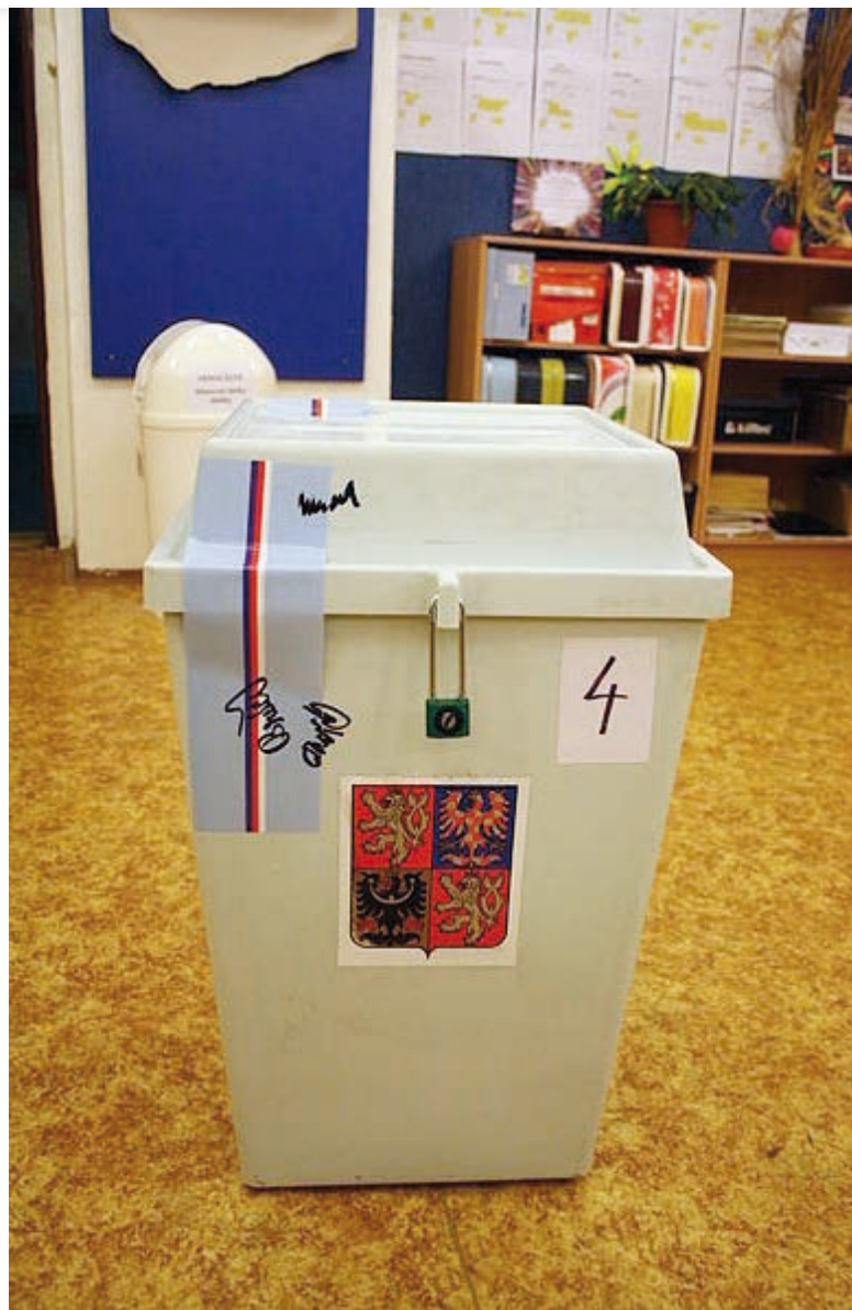
Volební urna [1]

Krajský soud v Ústí nad Labem návrh zamítnul, tj. konstatoval, že ke zpětvzetí kandidátky do voleb do krajského zastupitelstva došlo platně. Naopak Nejvyšší správní soud konstatoval, že magistrát pochybil, pokud zpětvzetí neakceptoval, neboť to bylo učiněno příslušnou osobou. V důsledku toho kandidátka za hnutí Severočeši.cz, která ve volbách poměrně jednoznačně zvítězila, kandidovala v roz-