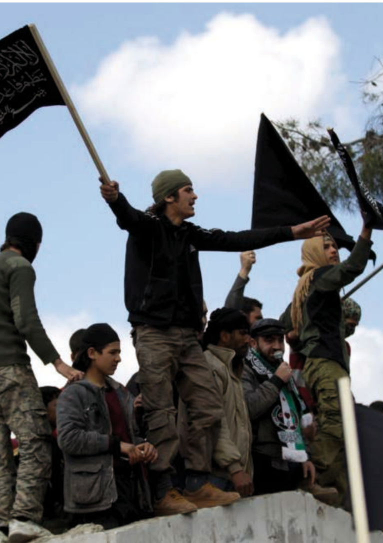
Členové hnutí Al-Nusra [3]

Obdobně reagoval zvláštní vyslanec OSN pro globální vzdělávání Gordon Brown po útoku na školní objekt v západní provincii Idlib, kde zemřelo nejméně 20 dětí a učitelů. Ve svém projevu vyzval Radu bezpečnosti, aby okamžitě souhlasila s tím, že věc postoupí Mezinárodnímu trestnímu soudu a provede vyšetřování toho, co podle něj odpovídá válečným zločinům.