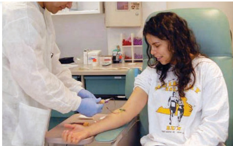
Odběr krevní plazmy [1]

Ve věci C-218/15 Paoletti a další se Soudní dvůr zabýval zásadou zákonnosti a přiměřenosti trestných činů a trestů, která je zakotvena v čl. 49 Listiny