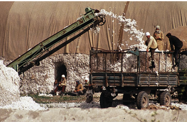
Bavlna po sklizni roku 1992 [2]