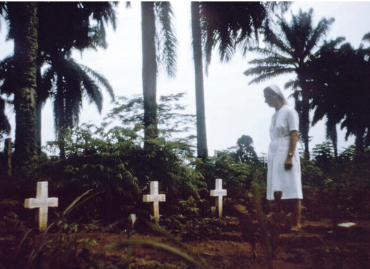
Řádová sestra navštěvuje hroby obětí Eboly, která v Zairu vypukla v roce 1976 [2]

umožněno, je třeba se stavět zdrženlivě. Okolnosti ve vztahu ředitelky a samotného vyloučení ještě nebyly soudem objasněny. Studium na zdravotní škole je bezesporu postaveno na předmětech jako jsou laboratoře, a to rozhodně ve vyšší míře než je ve středoškolském vzdělávání běžné. Z důvodu bezpečnosti by proto škola mohla nezahalování vyžadovat.