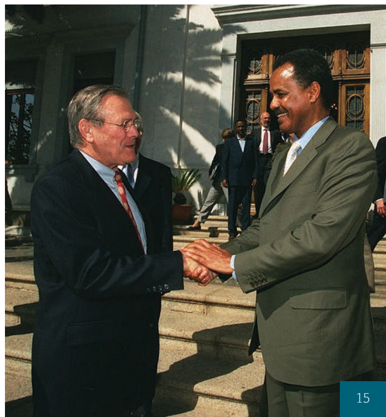
Donald Rumsfeld s Isaiasem Afewerkim [4]