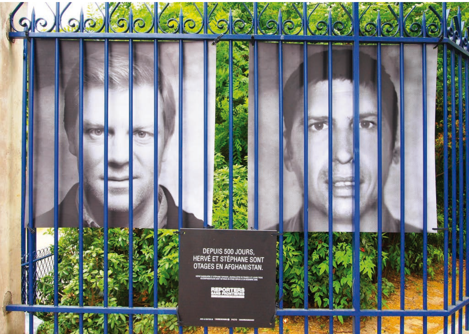
Reportéři, kteří byli drženi jako rukojmí 500 dnů [3]

ternetu, výjimku pak tvoří státní intranet zvaný „Turkmenet“, který je ovšem vysoce cenzurovaný. Turkmenistán je v Indexu těsně následován Sýrií (kde se situace razantně zhoršila po propuknutí občanské války v roce 2011) a Čínou.