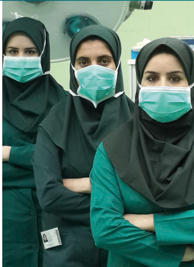
Íránské laborantky s hidžábem [1]

Evropský soud pro lidská práva omezení zahalení obličeje ve veřejném prostoru v zásadě umožňuje. Restriktivní přístup v zahalování státům již několikrát posvětil s odkazem na tzv. doktrínu uvážení. Musí jít o zákaz na základě zákona, opatření v demokratické společnosti nezbytné a sledující legitimní cíl. Takovýmto cílem může být bezpečnost, zdraví, veřejný pořádek a práva a svobody jiných.