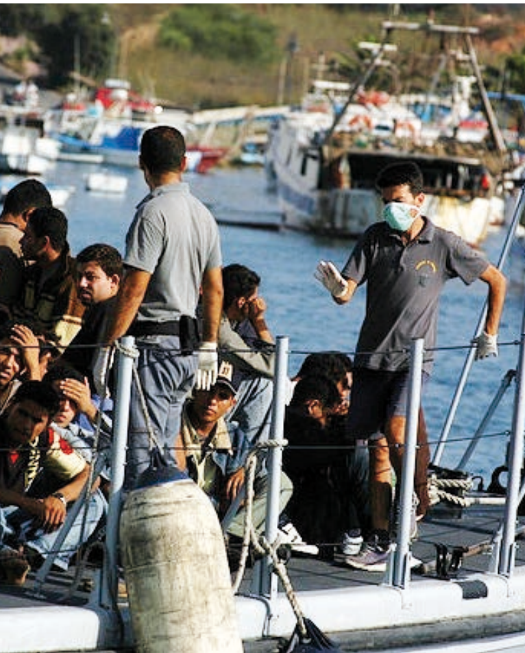
Uprchlíci přijíždějící na Lampedusu [3]

že se společnost musí snažit a migranty a uprchlíky podporovat. To je samozřejmě velká výzva.