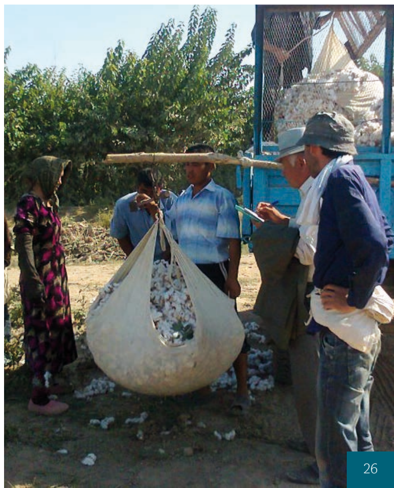
Vážení bavlny v roce 2012 [3]

[3] Vážení balny v roce 2012, autor: Shuhrataxmedov, CC-BY-SA-3.0.