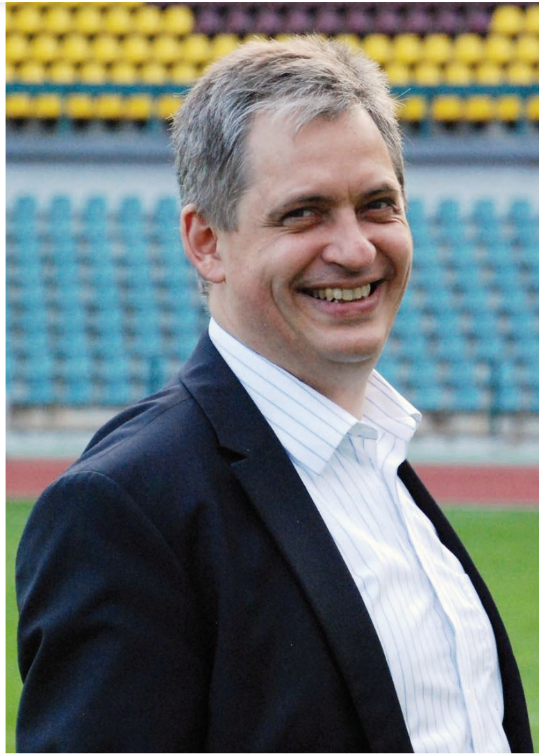
Jiří Dienstbier [1]

Dovolím se přesunout od aktuality k otázce obecné: Jak byste zhodnotil to, kam jsme se posunuli v otázce stavu lidských práv za dobu Vašeho působení ve funkci ministra pro lidská práva? Kupředu, stagnujeme či snad děláme kroky zpátky?