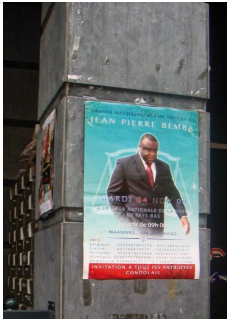
Jean-Pierre Bemba Gombo na plakátu v Bruselu [1]

V máji 2008 vydal MTS zatykač na Jeana-Pierra Bemba za spáchanie zločinu znásilnenia ako zločinu proti ľudskosti a vojnového zločinu; za zločin mučenia ako zločinu proti ľudskosti a vojnového zločinu; za zločin neľudského a ponižujúceho zaobchádzania ako vojnového zločinu a za plienenie a drancovanie dedín ako vojnového zločinu. Následne v júni 2008 bol zatykač doplnený o zločin vraždy ako zločinu proti ľudskosti a vojnového zločinu. K uvedeným zverstvám malo dochádzať od