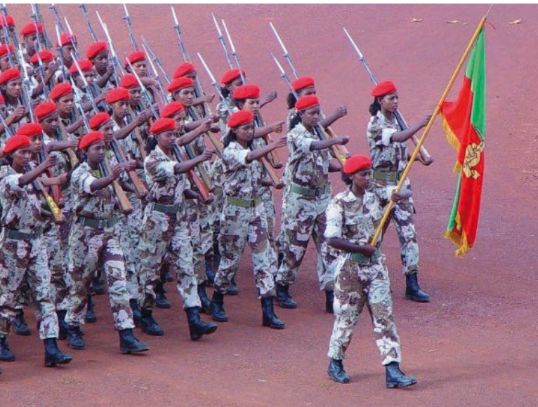
Vojákyňe Eritrejské armády [3]

zace jsou zakázané. O svobodě projevu nelze v podstatě v případě Eritrei ani hovořit. Vláda vlastní veškerá média. Výbor na ochranu novinářů označuje Eritreu za zemi, kde je největší cenzura na světě. Toto je však jen zlomek výčtu porušování lidských práv, ke kterému v Eritrei dochází.