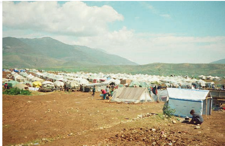
Tábor s kosovskými uprchlíky [2]

Dále může pomoci silné objektivní zpravodajství, zejména zodpovědní novináři, kteří dokáží reportovat obě strany. Snažíme se pracovat i s politiky, což je obtížné. Ne tolik proto, že by mezi politiky nebyli lidé, kteří mají podobné názory, jde však spíše o to, že politické strany jsou hodně populistické a tohoto