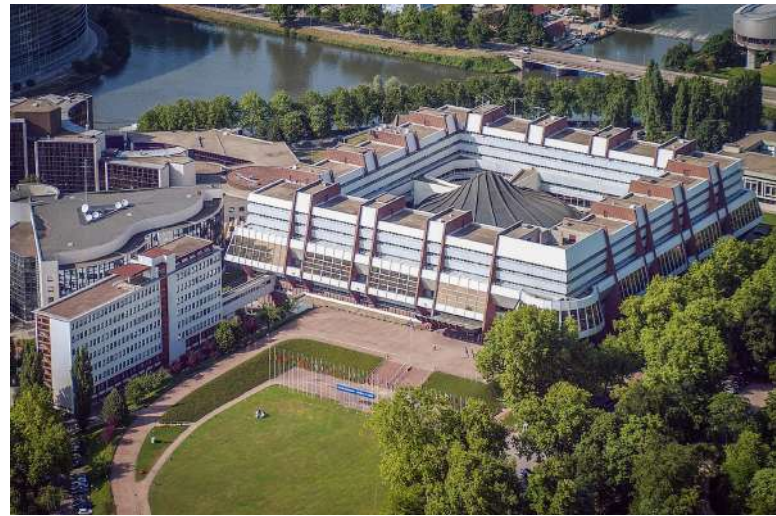
Budovy Rady Evropy ve Štrasburku [4]

Zároveň jsem také byla v denním kontaktu s ostatními stážisty z jiných zemí, kteří byli součástí dalších orgánů Rady Evropy. Díky tomu jsem poznala řadu dalších zajímavých lidí a dozvěděla se nejen o fungování dalších jednotek v Radě Evropy, kterých jsem přímo součástí nebyla, ale také o jiných evropských kulturách. Třešničkou na dortu pak bylo cestování, které jsem se stáží spojila a díky tomu poznala Francii v jejích různých podobách od Normandie až po Nice.