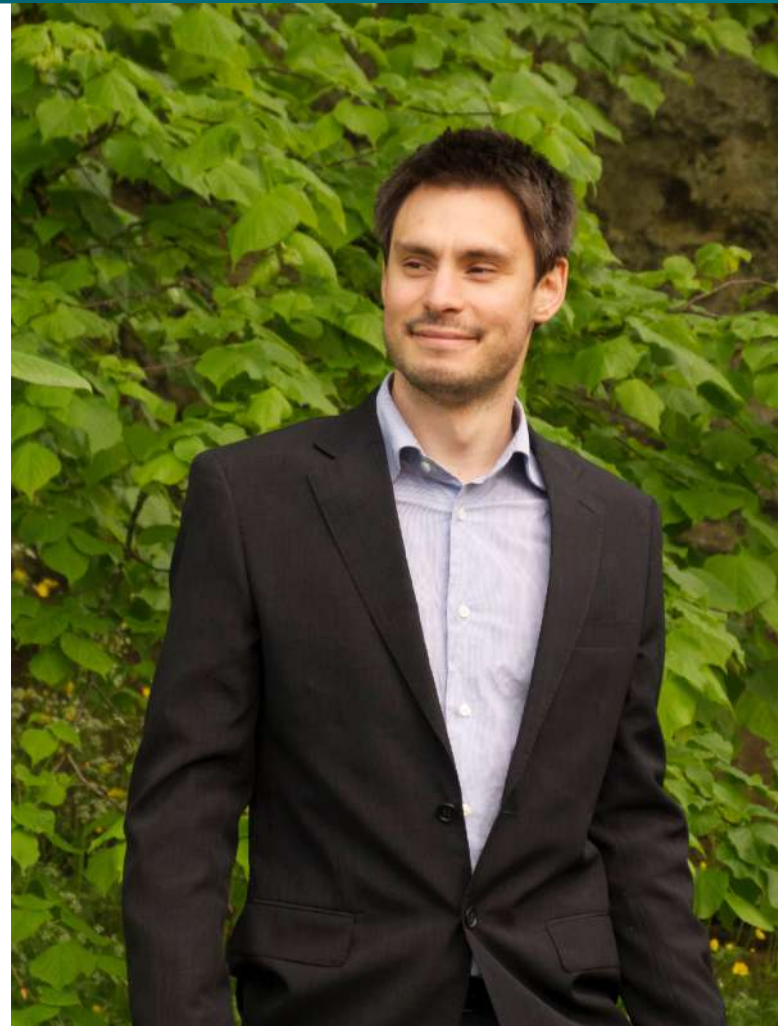
Giulio Regeni [1]

Klíčovou roli sehrály odbory například při svržení bývalého egyptského prezidenta Husního Mubárika během Egyptské revoluce v roce 2011 a také při převratu proti tehdejšímu prezidentovi Muhammadovi Mursímu v roce 2013. Současný prezident Abdal Fattáh Sísí se však po převzetí úřadu zasadil o to, aby došlo k omezení práv odborových organizací, včetně práva na stávkou. V roce 2018 přijal mimo jiné zákon, kterým rozpustil více než 800 nezávislých odborů.[2]