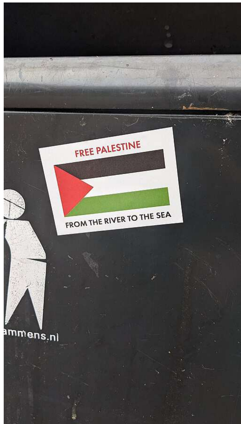
Soud zjišťoval povahu tohoto hesla [1]

Dne 27. února zveřejnila Kancelář veřejného ochránce práv statistiku, kde uvádí, jak ombudsman v posledních čtyřech letech využíval finanční zdroje z projektu Norských fondů [3], a tím se připravoval na případné rozšiřování svojí působnosti v oblasti ochrany lidských práv.