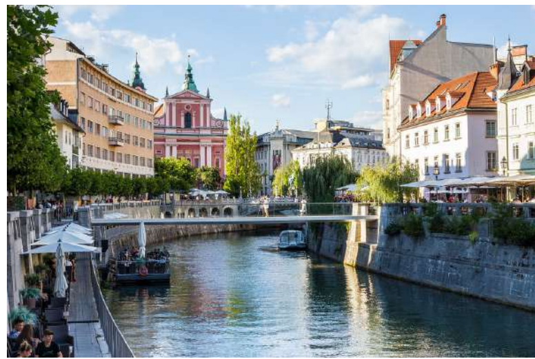
Text byl schválen po více než 10 letech úsilí v Lublani [5]

Řepka V. (2024, únor). Pavel Blažek v Haagu: „Podpis Úmluvy považují za významný krok vpřed v našem společném boji proti beztrestnosti a v úsilí o dosažení spravedlnosti pro oběti nejzávažnějších