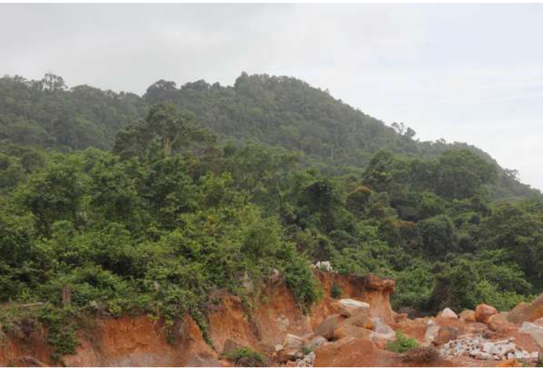
Opatření kambodžské vlády k ochraně přírody ohrožují domorodé kmeny [2]

vedla, že mezi lety 2018 až 2021 docházelo k zatýkání a týrání domorodých obyvatel zaměstnanci ministerstva a WA.