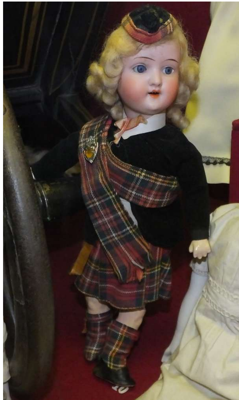
Dítěti byly již 3 roky [1]

Valc v kontextu EÚLP uvádí, že „relativní povaha práva na respektování soukromého a rodinného života ve smyslu čl. 8 Úmluvy [...] se vztahuje také k problematice práva dítěte znát svůj původ a okolnosti narození“.[2] Soud tedy do tohoto práva může zasáhnout jen v souladu se zákonem, pokud to je nezbytné v rámci demokratické společnosti, a to například v zájmu ochrany práv a svobod jiných.