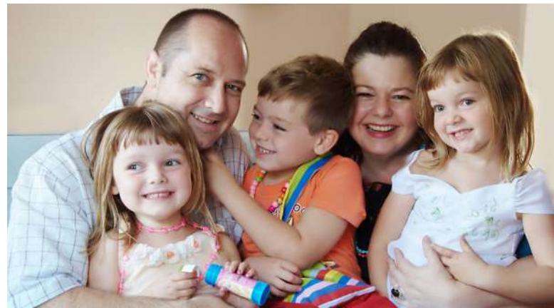
Právo nikoliv povinnost znát své rodiče [3]

ESLP se již problematice tzv. putativních otců věnoval [2]