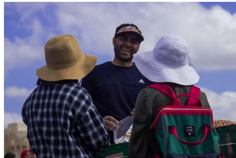
Stěžovatel byl cizinec bez úmyslu dlouhodobě pobývat v ČR [5]

právo znát svůj původ není povinností. Podle ÚS nebyla rozhodným ani odlišná barva pleti dítěte. Nakonec uzavřel, že dítě „nyní nebude pocítovat jako křivdu, když testy DNA bezprostředně provedeny nebudou“ a přijal možnost budoucí změny poměrů.