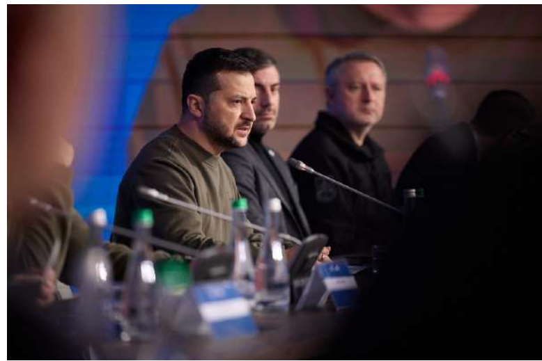
Projev ukrajinského prezidenta Volodymyra Zelenského [1]

Dominic Ongwen byl již v roce 2021 MTS odsouzen za válečné zločiny a zločiny proti lidskosti