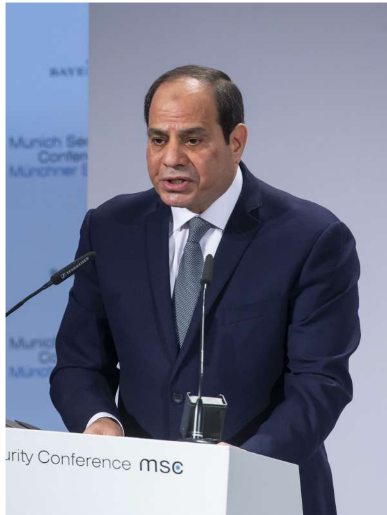
Abdel Fattah al-Sisi, egyptský prezident [2]

O rok později zahájil italský soudce Pier Luigi Balestrieri trestní řízení, které však bylo po krátké době přerušeno a vráceno k předběžnému projednání obžaloby s odůvodněním, že obvinění nebyli o obžalobě informováni. Římský státní zástupce