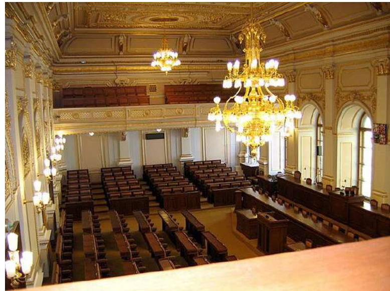
Novela trestního zákoníku prošla třetím čtením v Poslanecké sněmovně [3]

ESLP shledal, že orgány činné v trestním řízení sice nebyly neaktivní, nicméně počet vyžádaných lékařských prohlídek pro posouzení vážnosti poranění způsobil prodlevy v řízení. ESLP však uvedl, že opakované lékařské posudky byly nutné, neboť první dva byly nedostatečně odůvodněné. Je ale odpovědností státu, aby nastavil soudní systém tak, aby k takovým situacím nedocházelo. Stěžovatel nemůže nést negativní následky toho, že první dva posudky znalci nesprávně zpracovali. ESLP tedy uzavřel, že průtahy v řízení byly přičitatelné orgánům činným v trestním řízení a došlo k porušení čl. 3 Evropské úmluvy o ochraně lidských práv (dále jen „Úmluva“), který stanoví, že nikdo nesmí být mučen nebo podrobován nelidskému či ponižujícímu zacházení anebo trestu. Stěžovatel se domáhal porušení čl. 6 Úmluvy, který zakotvuje právo na spravedlivý proces. ESLP ale shledal, že příleha- vější bude procesní část článku 3. ESLP dále uvedl, že státy musí zajistit, aby v souvislosti se sexuálně motivovanými trestnými činy nedocházelo k pocitu beztrestnosti. Proto musí daný soud rozhodnutí