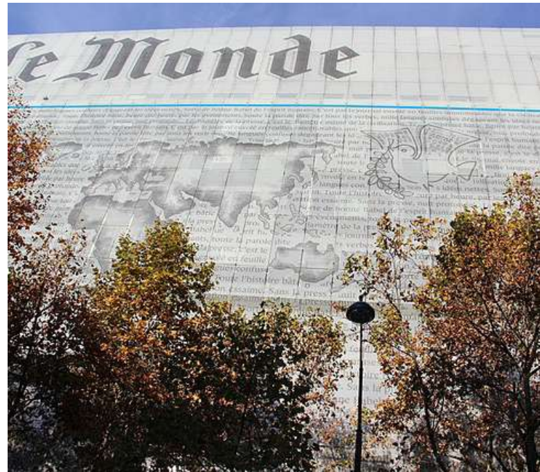
Real Madrid a lékař týmu žalovali Le monde [3]

Stát může zamítnout vykonatelnost rozhodnutí, pokud porušuje svobodu projevu [2]