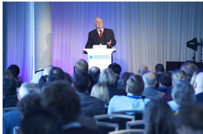
Peter Eigen, jeden ze zakladatelů a bývalý předseda Transparency International [1]

Transparency International v roce 2012 významně změnila metodologii, na jejímž základě získává a vyhodnocuje potřebná data. Index vnímání korupce před rokem 2012 a po něm proto nepředstavuje srovnatelné informace. Mění se i počet států, které jsou do žebříčku zahrnuty.