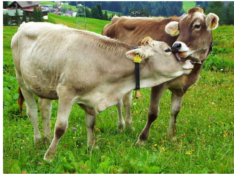
Zákaz porážky není v rozporu s EÚLP [1]

EU v posledních několika desetiletích podnikla významné kroky ke zlepšení systémů ochrany dětí ve svých členských státech. V roce 2014 požádala Evropská komise Agenturu Evropské unie pro