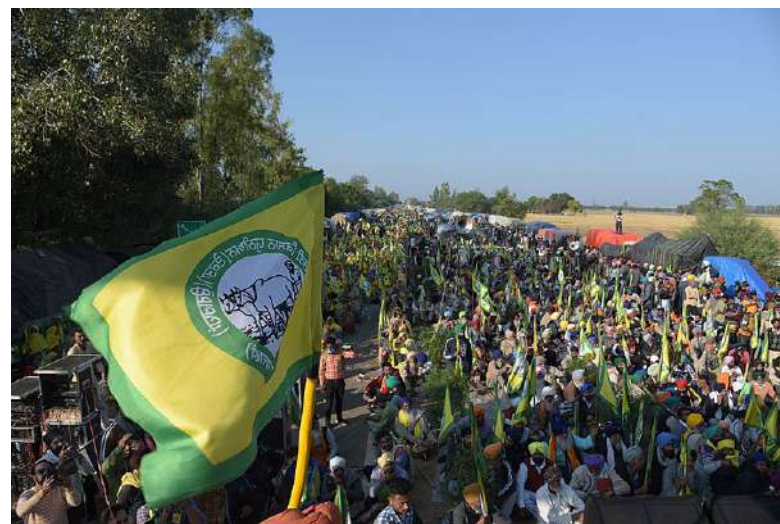
Protesty z roku 2020 přiměly indickou vládu farmářům vyjít vstříc [3]

Odborníci z Úřadu vysokého komisaře OSN pro lidská práva (OHCHR) upozorňují na obvinění ze závažného porušování lidských práv palestinských žen a dívek v pásmu Gazy a na Západním břehu. Ženy a dívky v Gaze byly údajně popravovány při útěku nebo hledání útočiště, a to společně s jejich rodinnými příslušníky, včetně dětí.