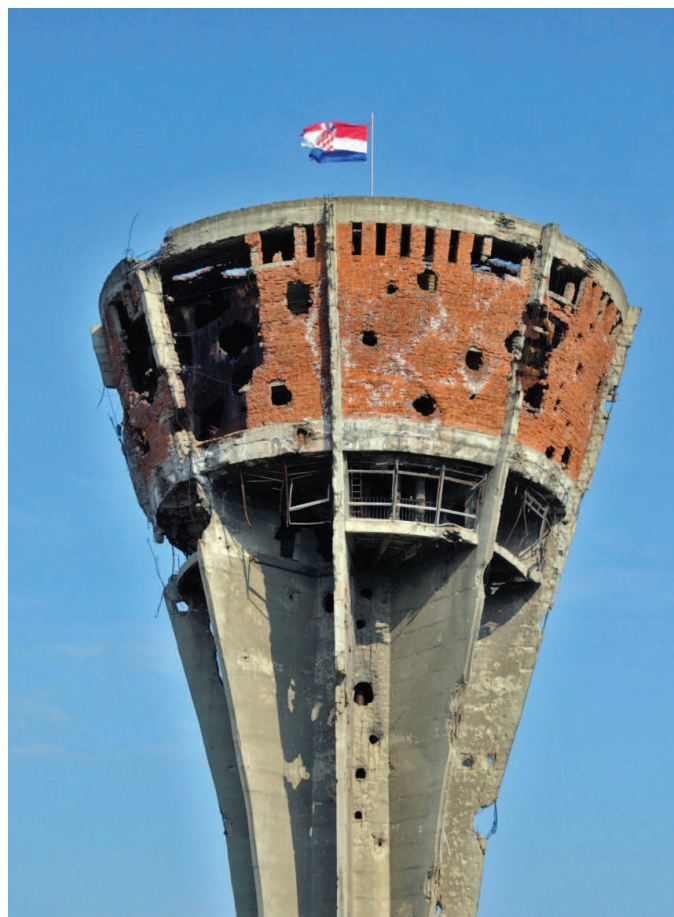
Zničený vodojem ve Vukovaru, který zůstal zachován jako symbol bitvy.

Vzhledem k tomuto dřívějšímu rozhodnutí se očekává, že MSD bude nynější záležitost rozhodovat rovněž v souladu se závěry ICTY. Ten za genocidu v jugoslávském konfliktu označil pouze masakr v Srebrenici. Předpokládá se tedy, že ani chorvatská ani srbská žaloba nebudou úspěšné a že aktuálně projednávané činy nenaplní veškeré prvky skutkové podstaty zločinu genocidy [2]. Současného řízení se účastní osm soudců, kteří nebyli přítomni při rozhodování bosenského případu, a tak jejich názor na případ genocidy před MSD není znám. Nicméně lze předpokládat, že i tito soudci budou rozhodovat v souladu s dosavadní praxí Soudu. MSD je navíc limitován svou jurisdikcí. Ta se vztahuje