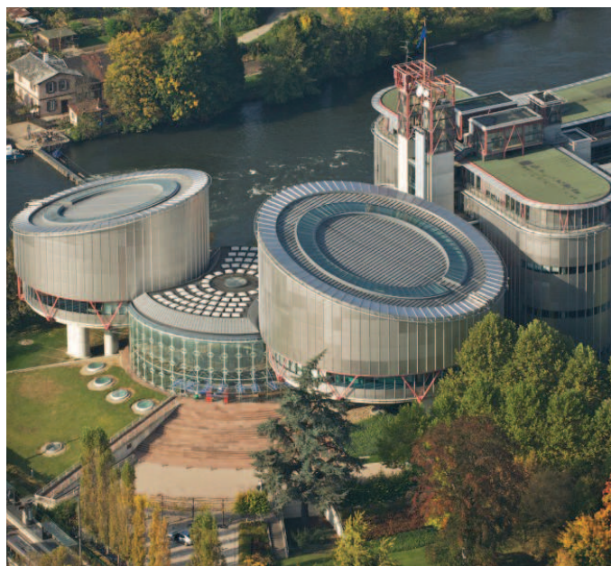
Snímek ESLP.

ESLP se blíže nezabýval otázkou, zda případ spadá do rozsahu článku 9 Úmluvy, protože shledal, že k diskriminaci nedošlo. Nejprve vykl, že má pochybnosti, zda vůbec došlo k odlišnému zacházení se srovnatelnými skupinami. Daňová povinnost se totiž aplikuje stejným způsobem na všechny náboženské organizace ve Spojeném království. I kdyby šlo