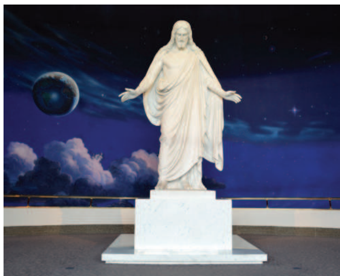
Mormonské ústředí v Salt Lake City

Ve věci Abdu proti Bulharsku [4] stěžovatel uvedl, že se stal obětí rasově motivovaného útoku. Národní orgány v řízení shromáždily důkazy, které prokázaly, že se Abdu účastnil rvačky. Nevědělo se však, ani kdo rvačku vyprovokoval, ani zda šlo o rasově motivovaný útok. Před ESLP se domáhal vyslovení, že bulharské orgány nedostatečně posoudily, zda byl útok skutečně rasově motivován, a tím porušily článek 3 (zákaz mučení a nelidského či ponižujícího zacházení) a článek 14 (zákaz diskriminace) Úmluvy.