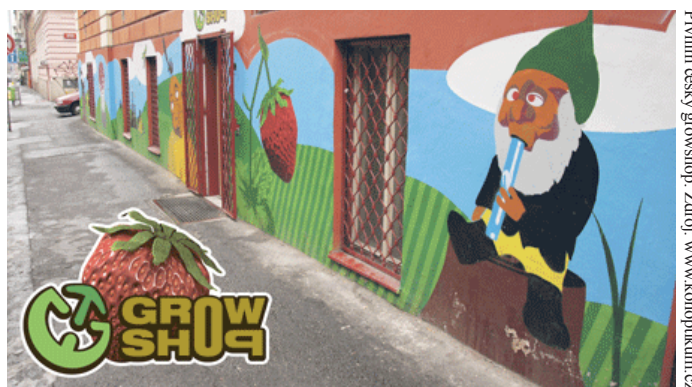
Prvním český growshop.

K prvním dvěma námitkám se Ústavní soud v podstatě argumentačně nevyjadřuje, pouze suše konstatuje, že s nimi nesouhlasí a naopak považuje postup obecných soudů za souladný s ústavním pořádkem. K poslední námitce se Ústavní soud vyjadřuje obsírněji,