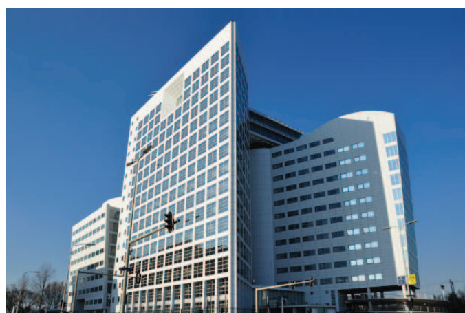
Mezinárodní trestní soud v Haagu.

Na rozsudek v případě Germaina Katangy je možné nahlížet z různých úhlů. Na jedné straně je třeba vnímat otázky týkající se změny stupně individuální trestní odpovědnosti a jejího vlivu na spravedlivý pro-