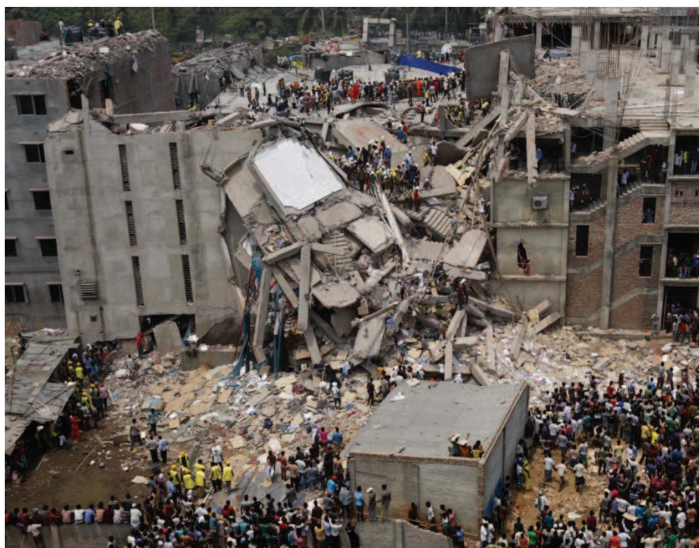
Zřícená budova Rana Plaza, zdroj: rians (flickr).

Mezi bezpečnostními závadami, které objevily inspekce provedené v reakci na zřícení Rana Plaza, bylo mimo jiné zamčené požární schodiště. To evokuje požár v newyorské Triangle Shirtwaist Factory z roku