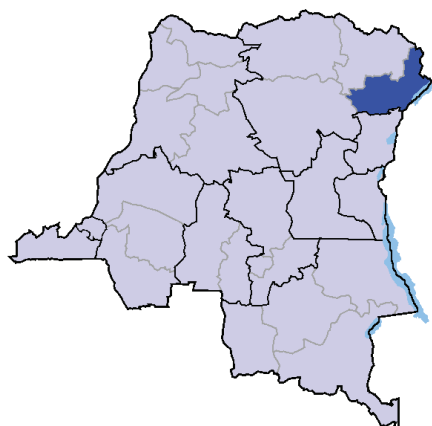
Region Ituri v Demokratické republice Kongo.

Waiting for Judgment: Communities in Ituri Await the Katanga Verdict with Impatience , International Justice Monitor, 14. března 2014 ( http://www.ijmonitor.org/2014/03/waiting-for-judgment-communities-in-ituri-await-the-katanga-verdict-with-impatience )