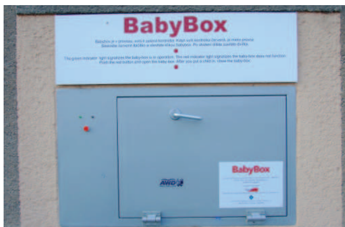
BabyBox. Zdroj: Wikipedia

Lze tak uzavřít, že obecný předpoklad správnosti názorů OSN a neschopnosti České republiky nemusí být vnímán jako absolutní.