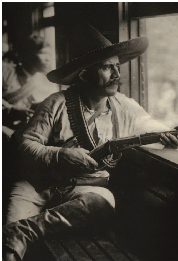
Mexická domobrana, zdroj: Wikipedia.

Hlavním argumentem, který zaznívá v odpovědi na otázku, proč se domobrana v Michoacánu nevy-