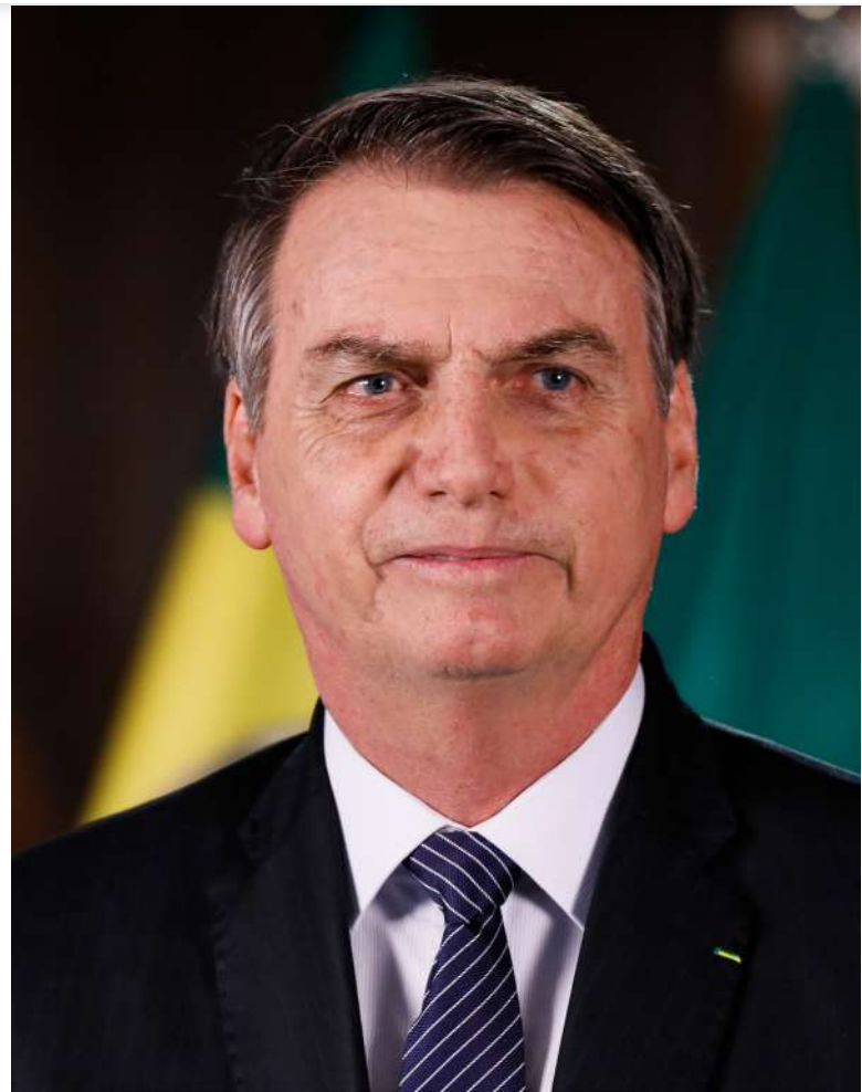
Brazilský prezident Jair Bolsonaro [2]

kteřé jsou skupinou pesticidů chemicky podobných nikotinu. Pro svůj silný účinek na nervový systém hmyzu se používají k jejich plošnému hubení. Evropská unie v roce 2018 zavedla téměř úplný zákaz neonikotinoidů z důvodu vážné újmy, kterou by mohly včelám a hmyzu celkově způsobit.