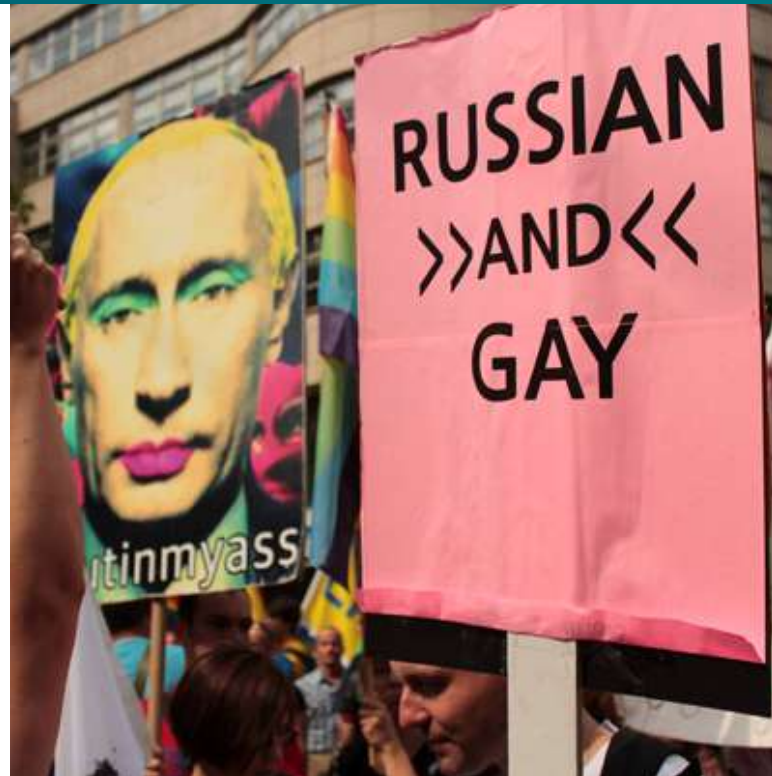
Protest Stop homofobii v Berlíně [1]

Velmi obdobný postup ruských orgánů zažil i druhý stěžovatel Alekseyev, který se neúspěšně snažil založit neziskovou organizaci Movement for Marriage Equality. Úřady odmítly toto sdružení zapsat. Když se Alekseyev obrátil na soud a namítal porušení ústavní-