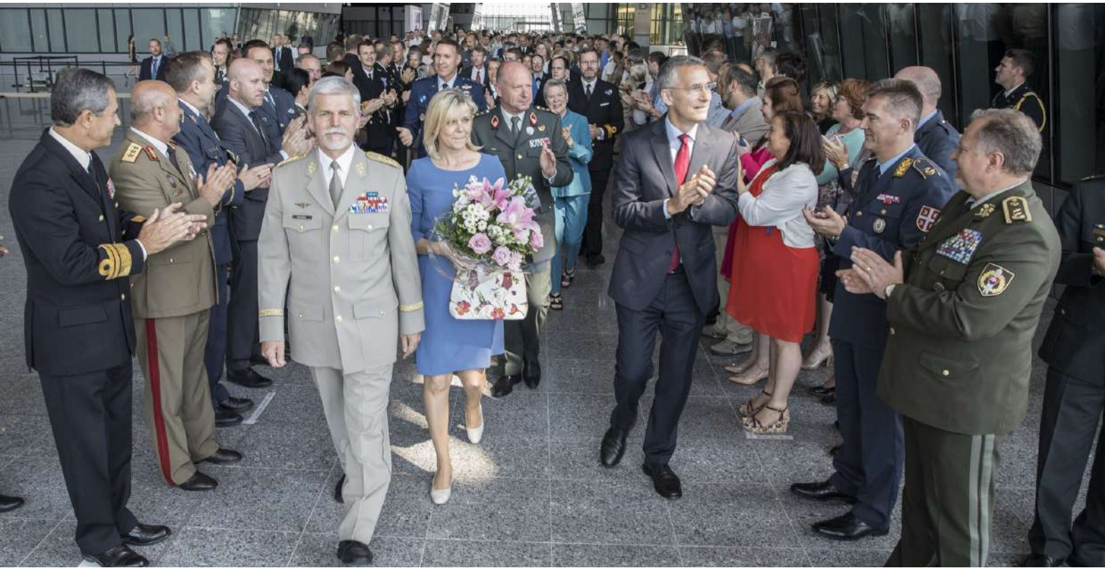
Petr Pavel v červnu 2018 oficiálně ukončil své působení ve funkci předsedy Vojenského výboru NATO [4]

opatření. Jakmile nebezpečí začne odeznívat, tak přítomnost bezpečnostních opatření samozřejmě začne veřejnosti vadit, protože ji svým způsobem omezuje.