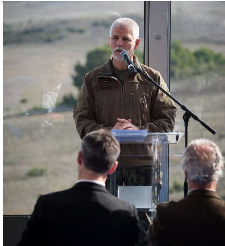
Bývalý předseda Vojenského výboru NATO Petr Pavel [1]

Předseda Vojenského výboru je také členem Severoatlantické rady, nejen jako účastník v zadní lavici, ale s právem jak zasedat přímo u jednacího stolu, tak s právem hlasovacím.