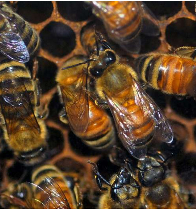
Ilustrační foto [3]