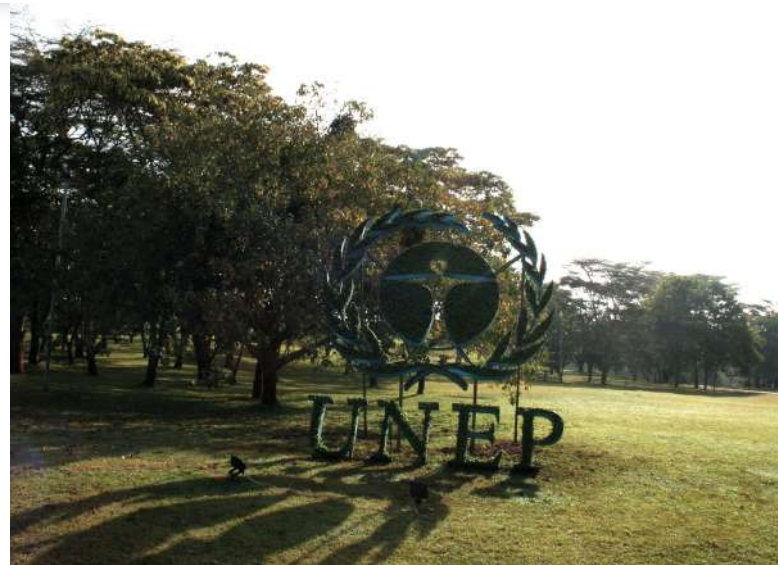
Logo UNEP [3]

Nová dohoda tak míří především k zastavení současné praxe zastrahování ochránců přírody a upřednostňování ekonomických zájmů nad ochranou životů lidí, kteří bojují proti devastaci přírody. Cílem je připomenout většině států, že mají ve svých právních rámcích zakotveno právo na příznivé životní prostředí a respekt k lidským právům, a že tato dvě práva by měla být prosazována a jejich porušování trestáno. Dohoda tak má vést k celosvětovému uznání tohoto práva a k podpoře nových mezinárodních i vnitrostátních politik založených na respektu k životnímu prostředí, zejména s ohledem na udržitelné využívání přírodních zdrojů, a k boji proti změně klimatu.