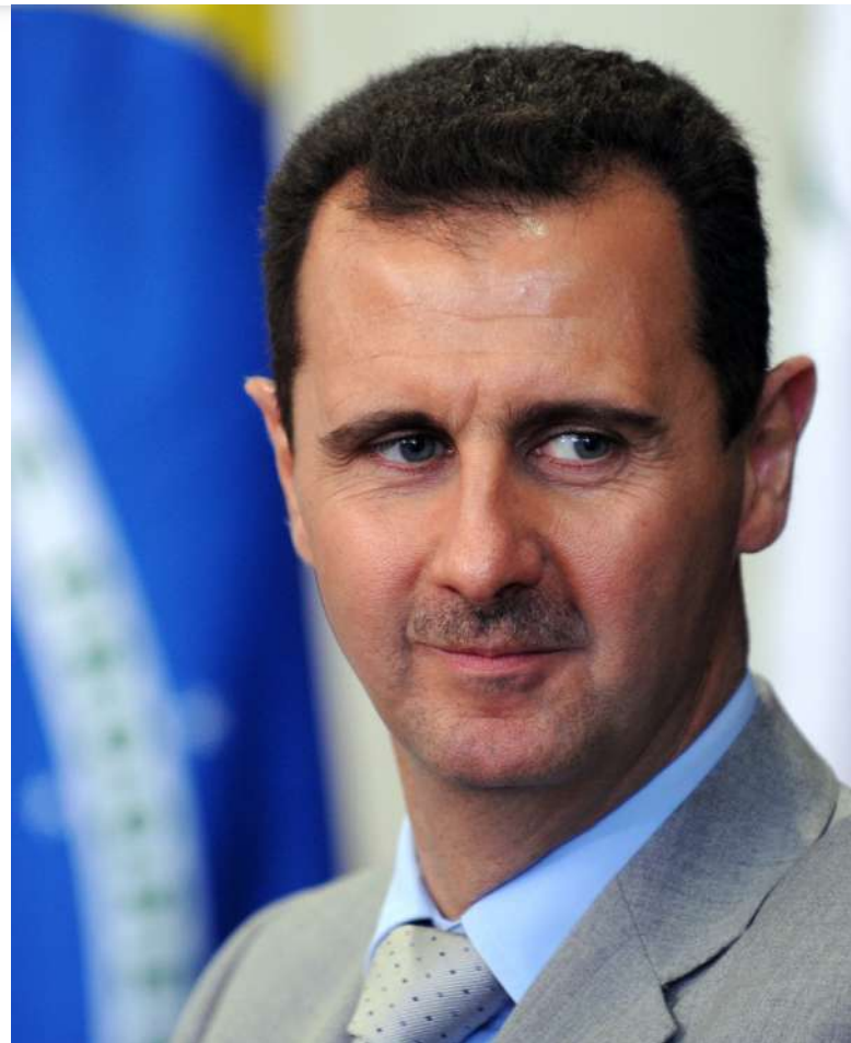
Bašár al-Asad [1]

Bylo dokázáno, že plyn sarin byl použit u mnoha útoků chemickými zbraněmi v Sýrii, přičemž jejich většina je připisována syrské vládě. Po masivním chemickém útoku v Ghoutě a následné mezinárodní