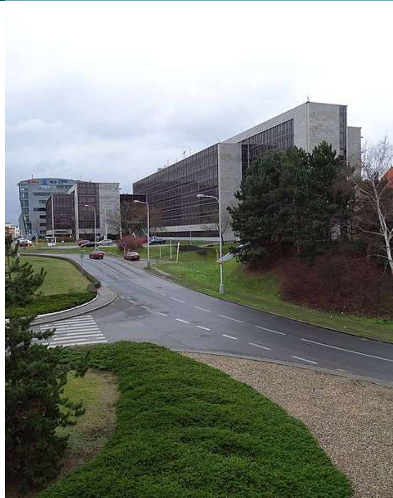
Budova Krajského ředitelství Policie ČR pro hl. město Prahu [1]

Stěžovatelka proto na základě doporučení sdělených své dceři (sestrě pohřešovaného) podala žádost na Policii ČR, která ji svým sdělením zamítla. Stěžovatelka poté podala správní žalobu na Městský soud v Praze. Žaloba byla odmítnuta s tím, že sdělení Policie ČR není rozhodnutím ve smyslu soudního řádu správního. Následně bylo i zastave-