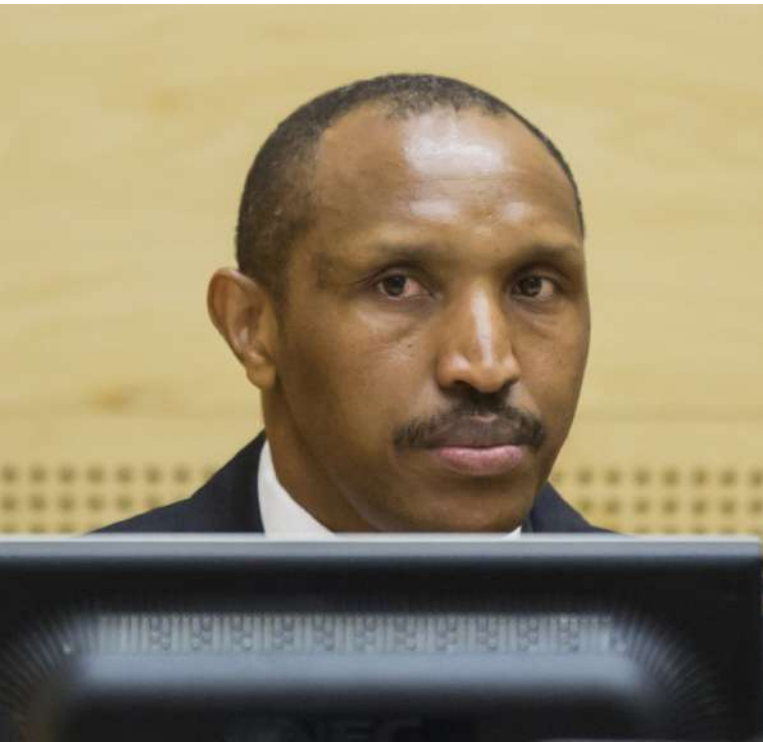
Bosco Ntaganda [4]

4. Kancelář si také klade za cíl zjemnit a zkvalitnit svůj přístup k obětem zločinů, zejména pokud se jedná o zločiny sexuálně a genderově motivované či zločiny spáchané na dětech. Žalobkyně chce podpořit zapojení obětí do soudních procesů a rozšířit interakci a komunikaci s oběťmi a jejich komunitami. Kancelář v této otázce dále plánuje prosazovat opatření napomáhající hlášení výše uvedených zločinů příslušným autoritám a dohlížet na implementaci takových opatření.