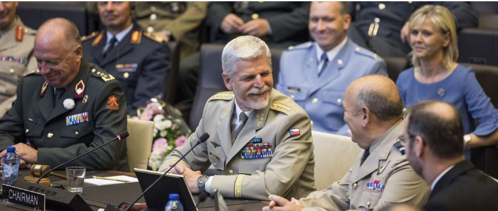
Generál Petr Pavel [2]

Když se podíváme pár let zpátky, došlo k zásadní změně, a sice nejen k masivnímu snížení mise z nějakých 140 000 vojáků na zhruba 16 000 dnes, ale především v charakteru mise. Do té doby byla bojová a jejím hlavním cílem byla porážka Talibanu jako hlavní opoziční skupiny. Přibližně před čtyřmi roky došlo ke změně strategie a mise byla změněna z bojové na asistenční. Její primární rolí bylo maximálně podporovat afghánské bezpečnostní složky, budování afghánských struktur, a to jak politických, tak vojenských, zpravodajských a dalších, aby byl Afghánistán schopen si poradit sám.