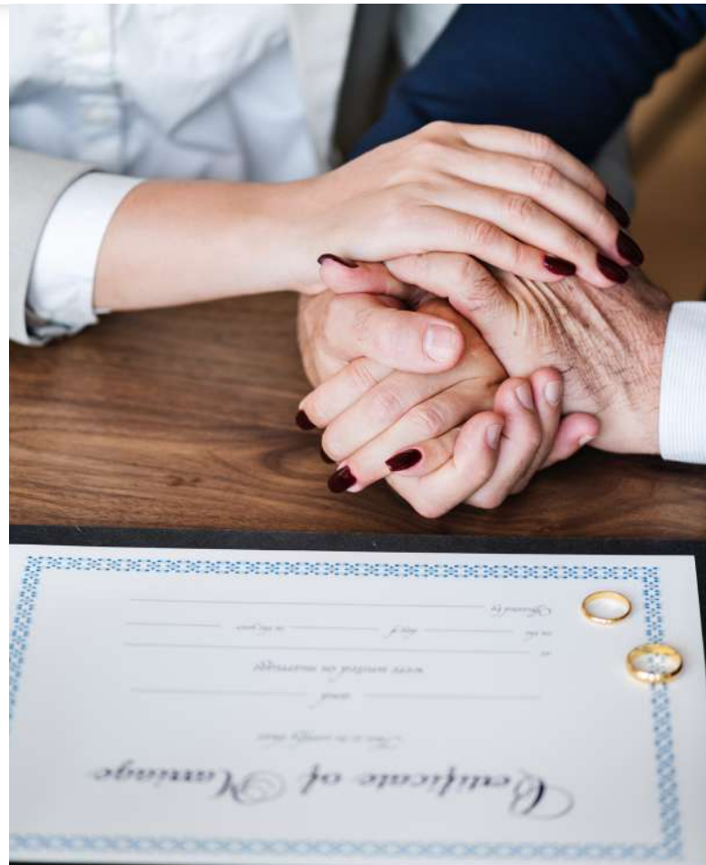
Oddací list [1]

Vládní zmocněnkyně Válková připomínkovala novelu s tím, že ženy by měly mít možnost svobodné volby při přechylování ženských příjmení. Válková připomínku podkládala argumentem uplatňování práva svobodné volby. Ministerstvo vnitra ani vlá-