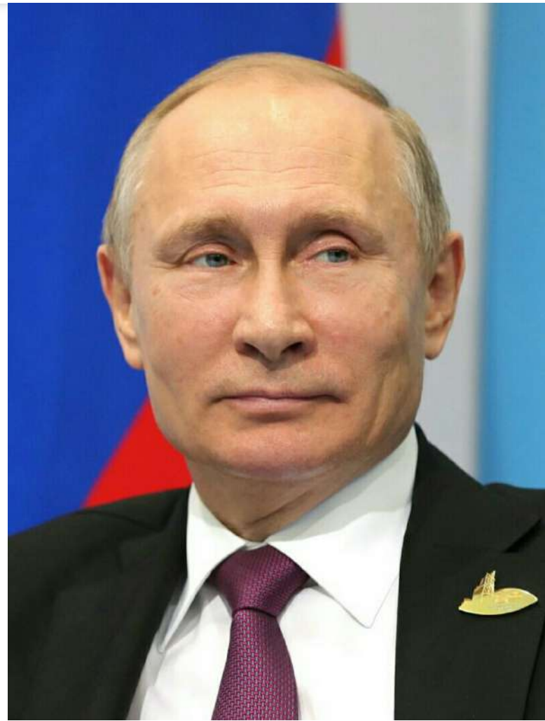
Vladimir Putin [1]

Ruská vláda považuje demonštrácie za protizákonné keďže Moskva nevydala povolenie k ich uskutočneniu. Práve preto mohla polícia pri protestoch zasahovať a protesty často násilne rozohnať. Ruská polícia zatkla stovky protestantov, z ktorých väčšinu na druhý deň prepustila. Štyri osoby boli kvôli činom spojeným s protestami odsúdené na trest odňatia slobody. Známy aktivista bol odsúdený až na štyri roky kvôli opakovanému porušovaniu zákonov. Protesty však boli vedené v pokojnom duchu a uskutočňovali sa vždy pred moskovskou radnicou. Aj keď oficiálne štatistiky ruskej polície hovoria, že protestov sa zúčastnilo asi dvetisíc osôb, z videí a fotiek publikovaných protestantmi sa odhaduje účasť približne päťdesiat tisícov ľudí. Jedná