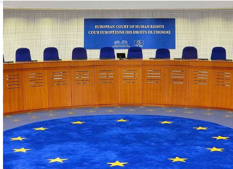
Evropský soud pro lidská práva [3]

Deník Referendum. 2019. Zhrouť se bez přechýlování čeština? J. Chromý ( http://denikreferendum.cz/clanek/30109-zhrouti-se-bez-prechylovani-cestina?fbclid=IwAR31mfmiCVYXGLkc94t-3Kwy3e_YccP4DO8llvgAJVZ1U_Ou5C_0uxzXzu0 )