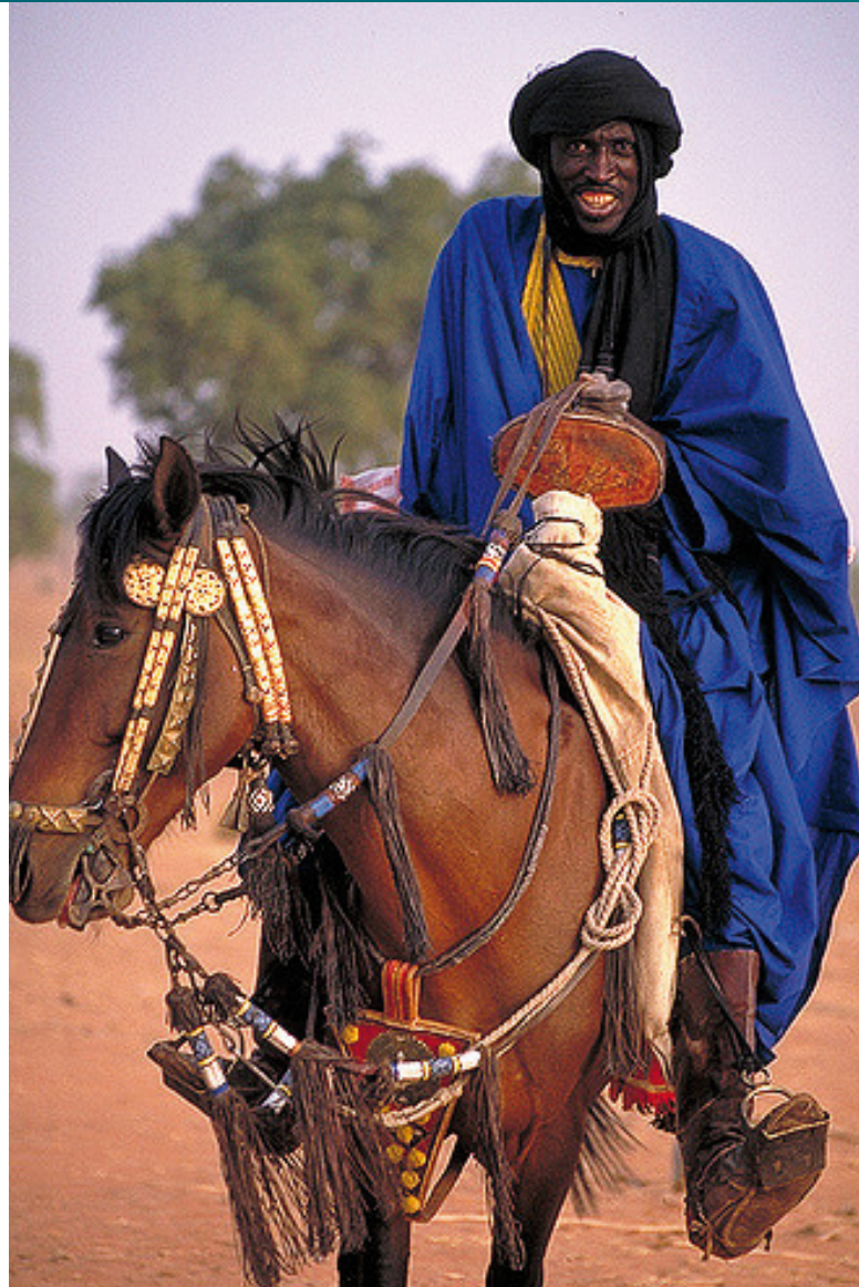
Tuarégsky muž v Mali [1]