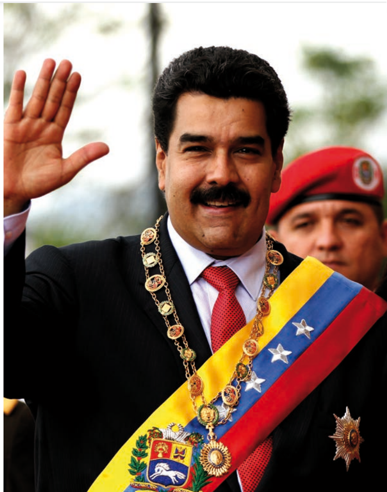
Prezident Nicolás Maduro [1]

Ve Venezuele v roce 2017 docházelo k rozsáhlým demonstracím proti vládě prezidenta Madura a proti rozhodnutím Nejvyššího soudu, který dočasně rozpustil opozicí ovládaný legislativní orgán – Národní shromáždění. Prezident se pak ujal zákonodárné moci sám a rozhodl se Národní shromáždění