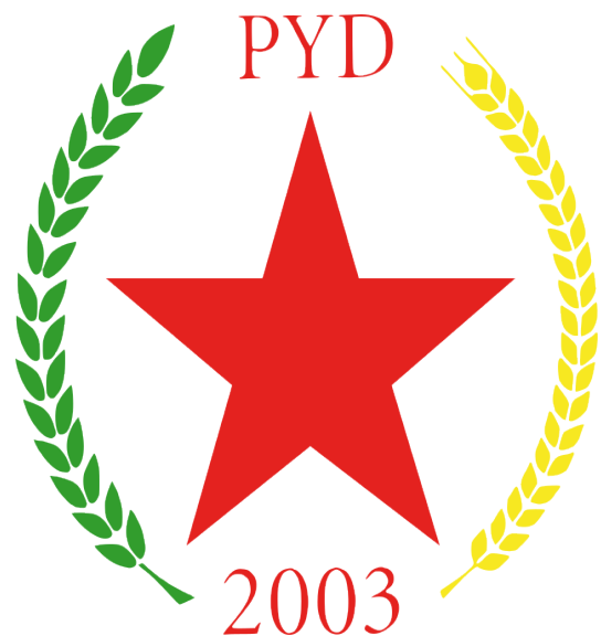
Logo Strany demokratickej únie [3]

Celá kauza nevykresľuje postup českých orgánov v najlepšom svetle. Advokát v rozhovore pred