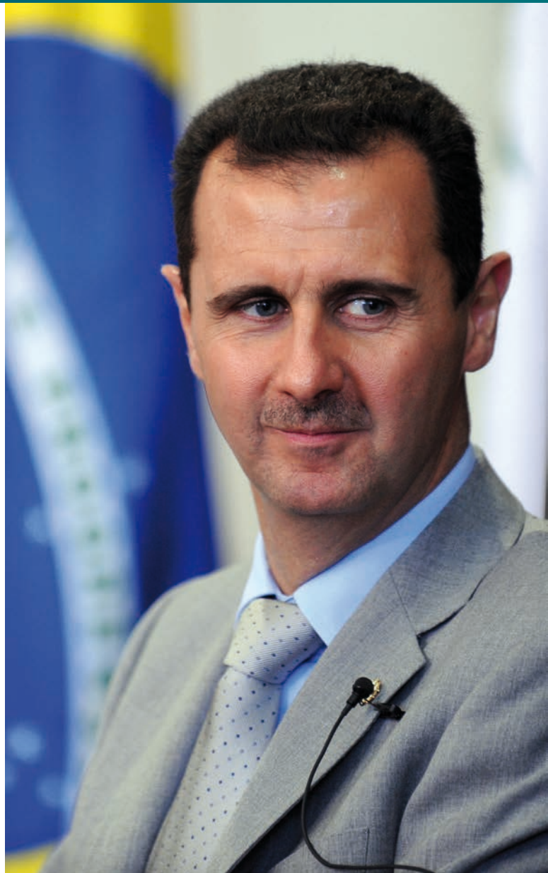
Bašár al-Asad [1]

Francouzská vláda upozornila na to, že po útocích na město Chán Šajchún v roce 2014 se Asadův režim pokoušel získat desítky tun izopropylalkoholu. V období od května 2014 do prosince 2016 bylo do Sýrie dodáno celkem 24 dodávek tří vzájemně spo-