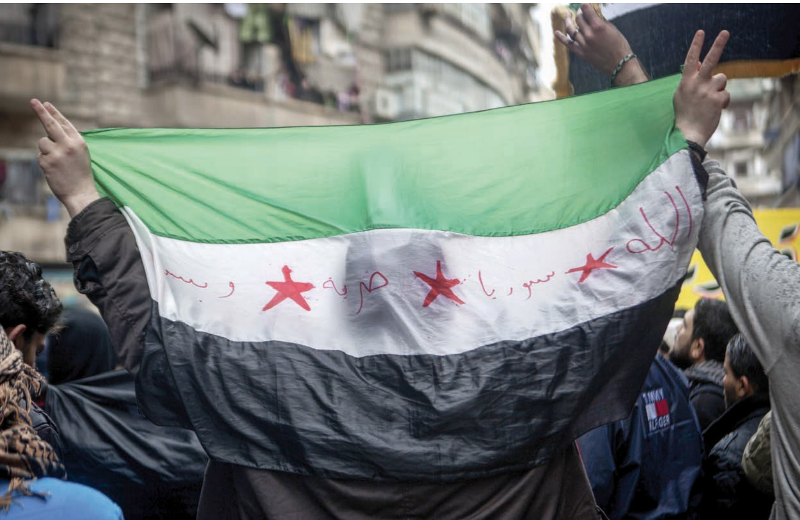
Demonstrace proti Asadově režimu v Aleppu [2]

v belgických Antverpách. Za nepravdivý vývoz zboží, které podléhá povolení, mohou být firmy a odpovědné osoby potrestány odnětím svobody v délce od 4 měsíců do 5 let.