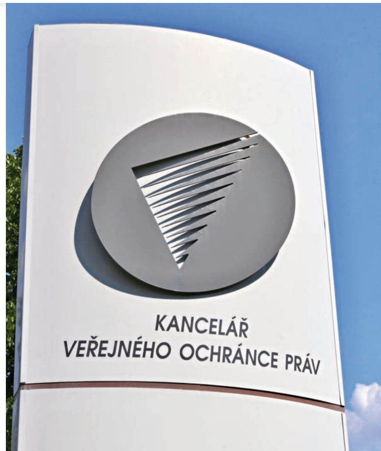
Kancelář veřejného ochránce práv [1]

Kritizuje i povinnost osob předkládat v jakémkoliv úředním styku matriční doklady vydané zvláštní