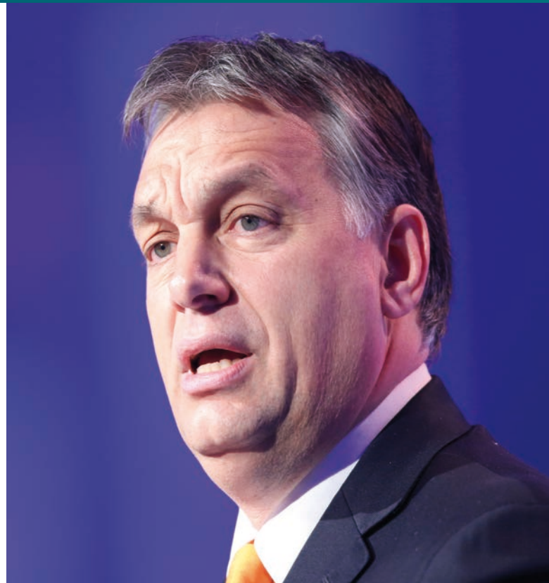
Maďarský premiér Viktor Orbán [1]

Situace týkající se svobodných médií v zemi se však od té doby ještě zhoršila. Podle hodnocení americké nevládní organizace Freedom House, která se zaměřuje na stav demokracie a svobodu médií, jde letos již o desátý rok v řadě, kdy se stav demokracie v Maďarsku zhoršil. Jako jediná ze zemí V4 také podle tohoto hodnocení již nespadá do kategorie konsoli-