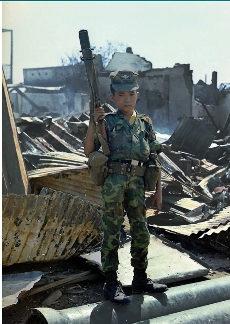
Dětský voják [1]

Sedmičlenný gang je vinen ze spáchání trestných činů obchodování s lidmi, otrokářství a praní špinavých peněz. Gang totiž nejen že „ubytoval“ oběti ve sklepeních, kde byly tyto často svázaný řetězy, ale také je okrádal o jejich vydělané peníze, které jim řádně přišly od agentury, která je zaměstnávala. Otrokáři své oběti zneužívali i tak,