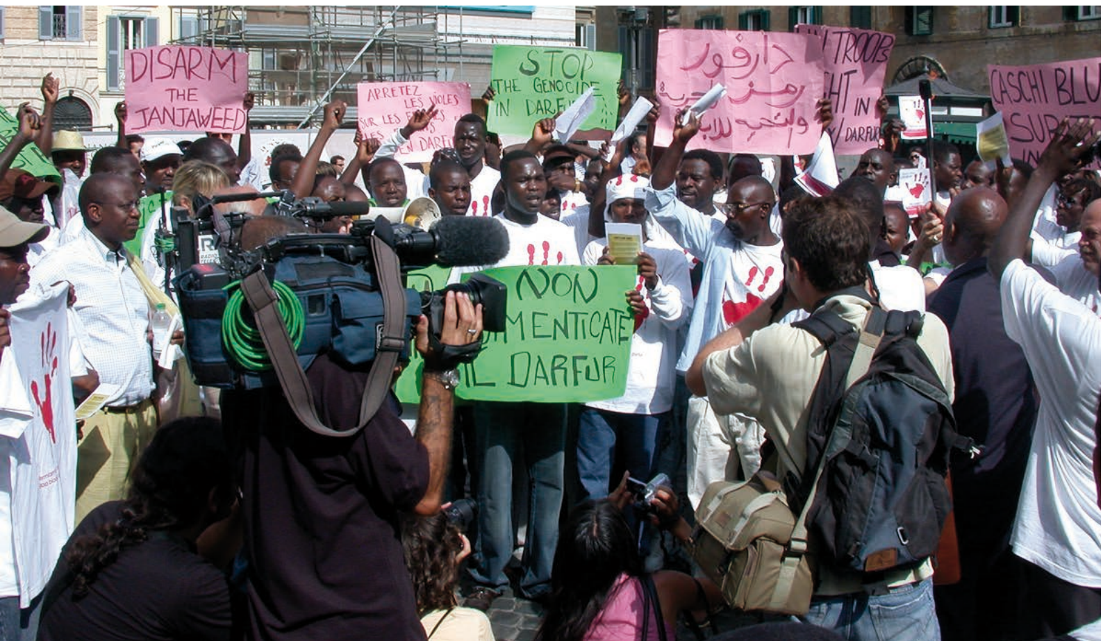
Demonstrace proti etnickému násilí v Dárfúru [2]

kladě Římského statutu. Zatímco v případě smluvních stran a států, které uznávají jurisdikci MTS, je třeba primárně uplatnit čl. 27 odst. 2 Římského statutu zakotvující zákaz zohledňování případných imunit či zvláštních procesních pravidel, režim čl. 98 Římského statutu se vztahuje na státy, jež prozatím k této mezinárodní smlouvě nepřistoupily. Podle názoru MTS však z daného pravidla existuje výjimka, a to rozšíření aplikace čl. 27 odst. 2 Římského statutu na nesmluvní strany na základě rezoluce Rady bezpečnosti (RB) OSN.