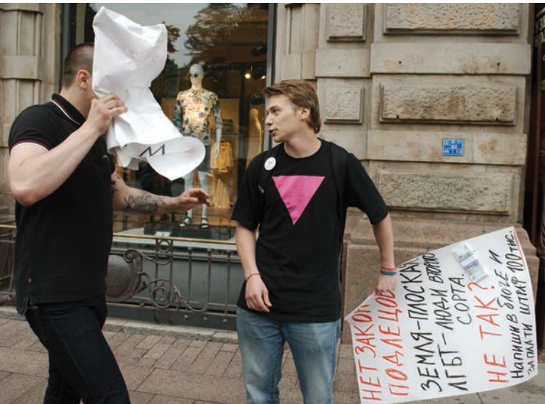
Napadení LGBT aktivisty v Petrohradě [2]