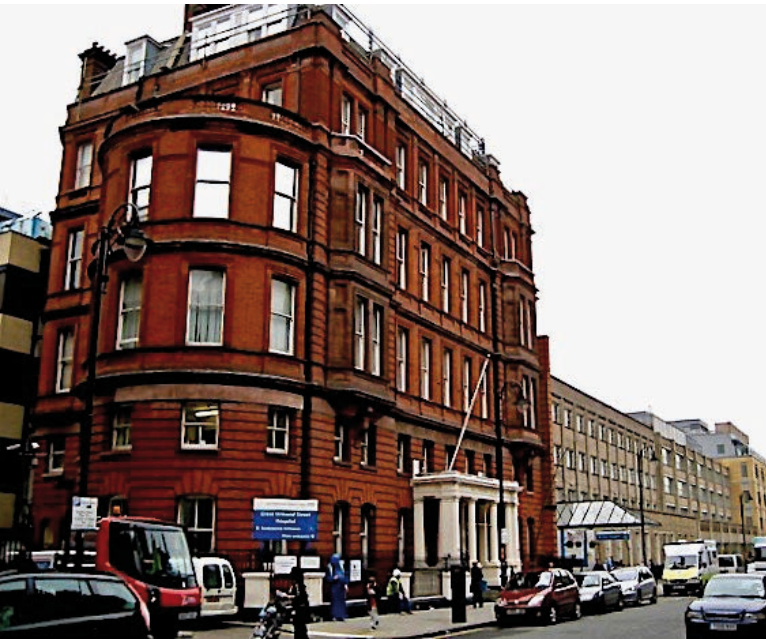
Část nemocnice Great Ormond Street Hospital [3]

posouzení stavu pacienta. Postupy ukončování či nepokračování léčebných postupů mohou být vnímány jako neoprávněné ukončování něčeho, na co má pacient právo.