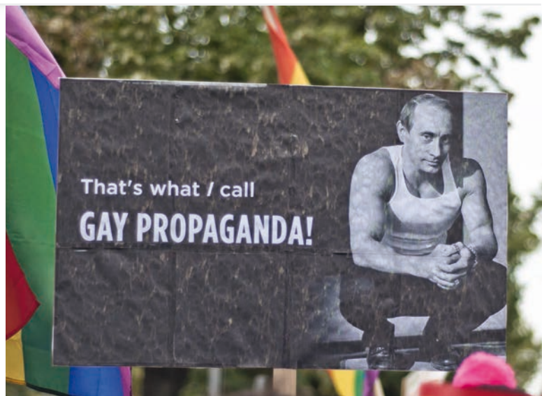
Banner z berlínské demonstrace proti přijatým homofobním zákonům v Rusku [3]