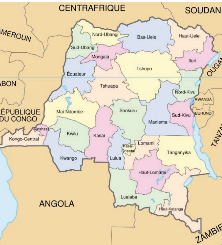
Regiony DRK v roce 2005 [2]

Soud zároveň zdůraznil, že tato symbolická částka nekompensuje újmu v celém rozsahu, ale poskytuje smysluplnou útěchu za újmu, kterou oběti utrpěly. Dále bylo rozhodnuto o kolektivních reparacích v podobě podpory bydlení, pomoci při vzdělání, psychologické podpory a podpory při tzv. příjem generujících aktivitách ( income-generating activities ). [2]