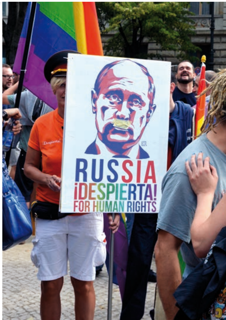
Berlínská demonstrace před Ruskou ambasádou [1]

Dostat se k faktům takových případů a informovat o nich je značně složité, jelikož příslušníci sexuálních menšin žijí v permanentním ohrožení a snaží se na svou orientaci neupozorňovat. Velice často nenajdou pochopení ani mezi svou vlastní rodinou, která je vyzývána ke smytí tzv. hanby cestou krve. Asi nejlépe tak situaci v Čečně dokresluje slova poradkyně pro lidská práva prezidenta-tyrana