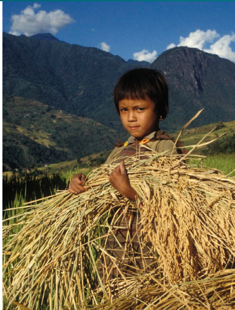
Dětská práce [1]