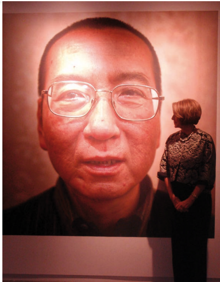
Portrét Liou Siao-po v Centru Nobelovy ceny za mír [1]

Podobně jako udělení Nobelovy ceny míru v roce 2010 vyvolala i smrt Liou Siao-po překotnou aktivitu čínských cenzorů, aby tato událost nespustila nějaké protirežimní nepokoje. Podle analýzy institutu The Citizen Lab z University of Toronto bylo dokonce poprvé použito filtrování fotek v osobních zprávách mezi uživateli čínských sociálních sítí. Obvyklou otázkou mezi přáteli na čínském chatu tak bylo „Viděls, co jsem teď poslal?“ a odpovědí bylo často „Nic nepřišlo“. Jak to nicméně bývá obvyklé v případě cenzury, lidé si najdou svoji cestu a Číňané tak sdíleli například úryvky z básní zemřelého disidenta.