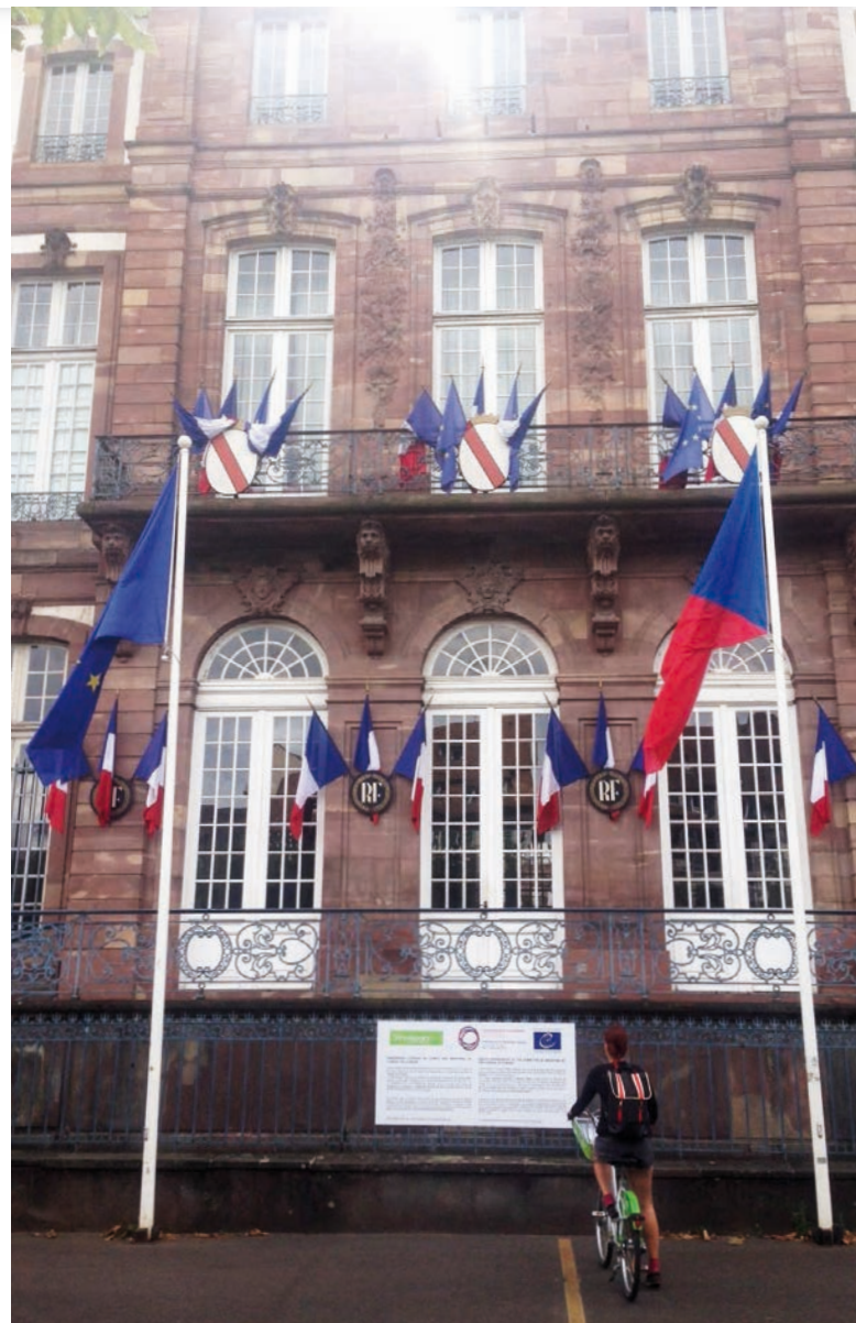
Vlajka České republiky vyvěšená na počest předsednictví na magistrátu města Štrasburk [1]

Česká republika převzala předsednictví od Kypru na zasedání Výboru ministrů v Nikósii v polovině května, kde ministr zahraničí Lubomír Zaorálek rovnou představil všechny priority země v rámci předsednictví, jakož i navazující odborné akce, které se budou konat částečně ve Štrasburku a částečně v Praze. V navazujícím prvním vystoupení před Parlamentním shromážděním Rady Evropy, které každoročně uděluje cenu Václava Havla za lidská práva (a kreativní disent), se pak k odkazu Václava Havla výslovně přihlásil a konstatoval, že právě jeho myšlenkami byly údajně program a priority předsednictví silně inspirovány. Zaorálek uvedl: „Více než před dvěma desetiletími to byla právě Rada Evropy a její Parlamentní shromáždění, které nás krátce po pádu komunistického režimu opatrně vedly zpět do rodiny evropských demokracií.“