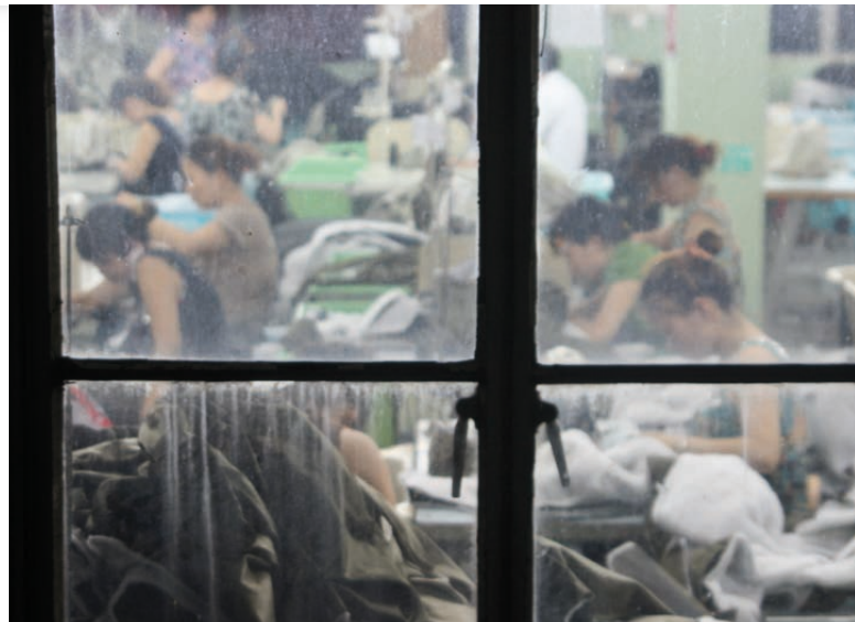
Bezpečnost práce [3]

■ změna brazilské ústavy z roku 2012: vláda může odejmout majetek osobám či firmám, jež mají prospěch z otroctví či nucené práce