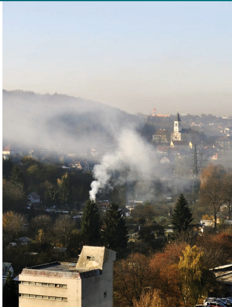
Stacionární zdroje znečištění – kotle v domácnosti [1]

Ústavní soud se vyjádřil také v několika dalších zásadních případech. Již před dvěma lety odmítl zrušit tzv. služební zákon,[3] čímž se tzv. „Zemanův“ Ústavní soud vymezil vůči výkonné moci. Za zmínku pak stojí tři „letní“ nálezy. V prvním z nich Ústavní soud posuzoval, zda je ČEZ povinným subjektem podle zákona o svobodném přístupu k informacím.[4] Ústavní soud přitom dospěl