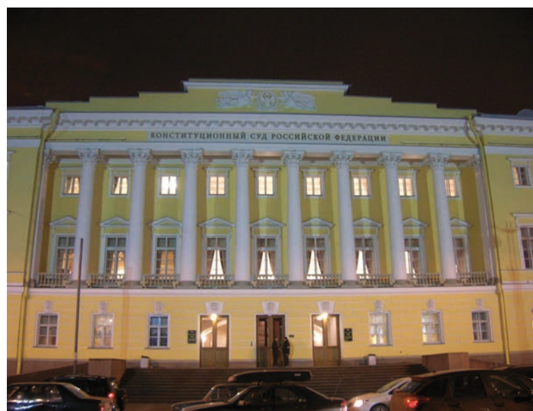
Budova Ústavního soudu Ruské federace [4]