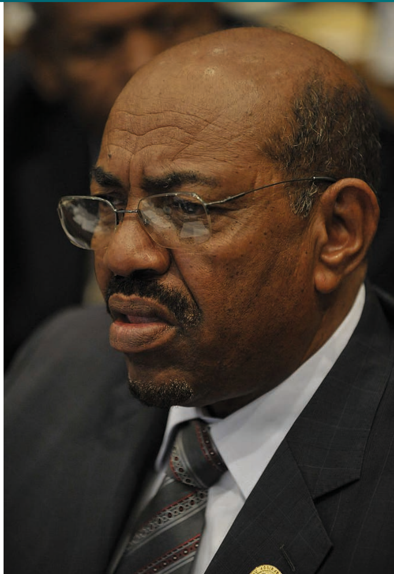
Súdánský prezident Umar Al-Bašír [1]

Více pozornosti naopak MTS věnoval námitce, že výkon národní trestní jurisdikce vůči soudánskému