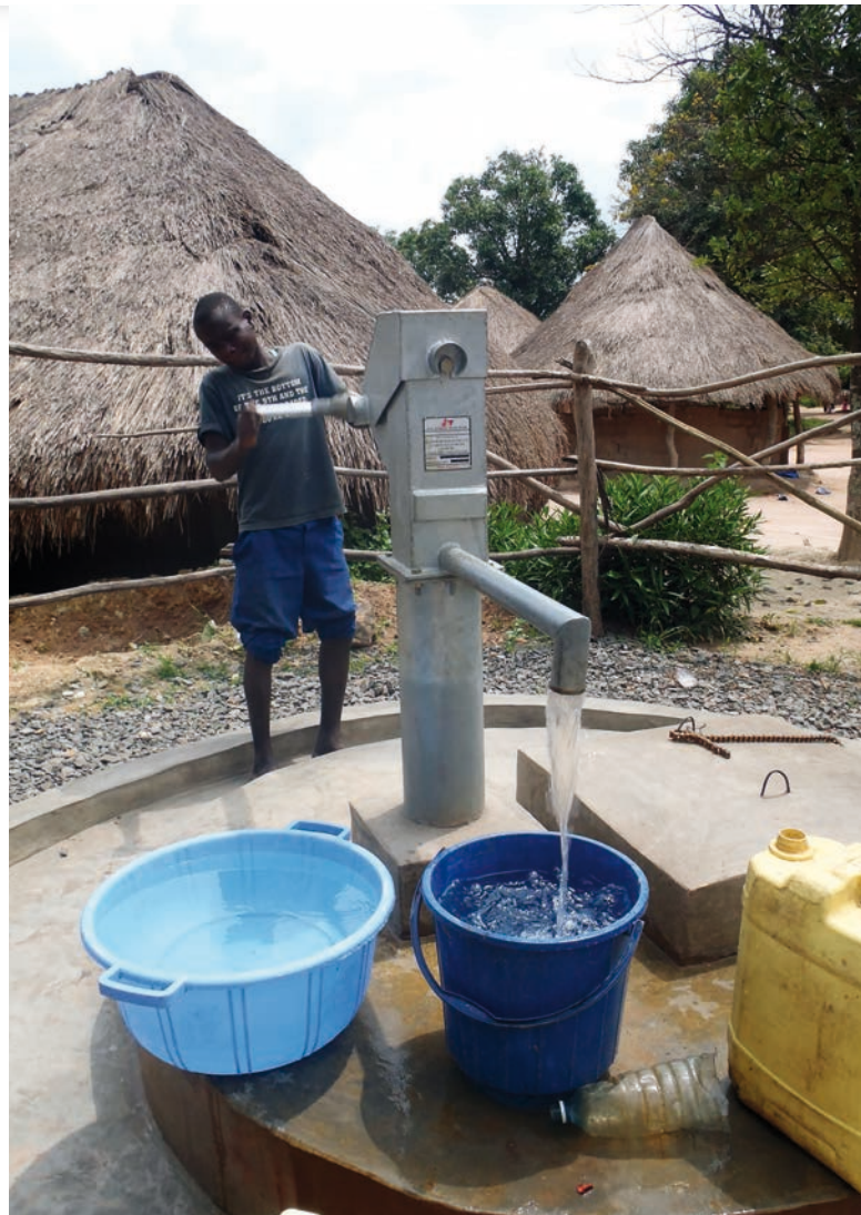
Konžská vesnice v roce 2012 [1]

Byť byl Germain Katanga odsouzen již před delší dobou, o reparacích pro oběti zločinů spáchaných ve vesnici Bogoro bylo rozhodnuto až poměrně nedávno. Germain Katanga sledoval proces rozhodování o reparacích na dálku, a to prostřednictvím videopřenosu z věznice Makala v Demokratické republice Kongo. Aby se zajistilo, že budou zainteresované osoby o všem dostatečně informovány (zejména žadatelé o reparace a ovlivněné komunity), pořádaly se za tímto účelem následně ve vesnicích Demokratické republiky Kongo tzv. outreach aktivity (aktivity mající za cíl poskytnout informace, ke kterým by se jinak lidé stěží dostali).