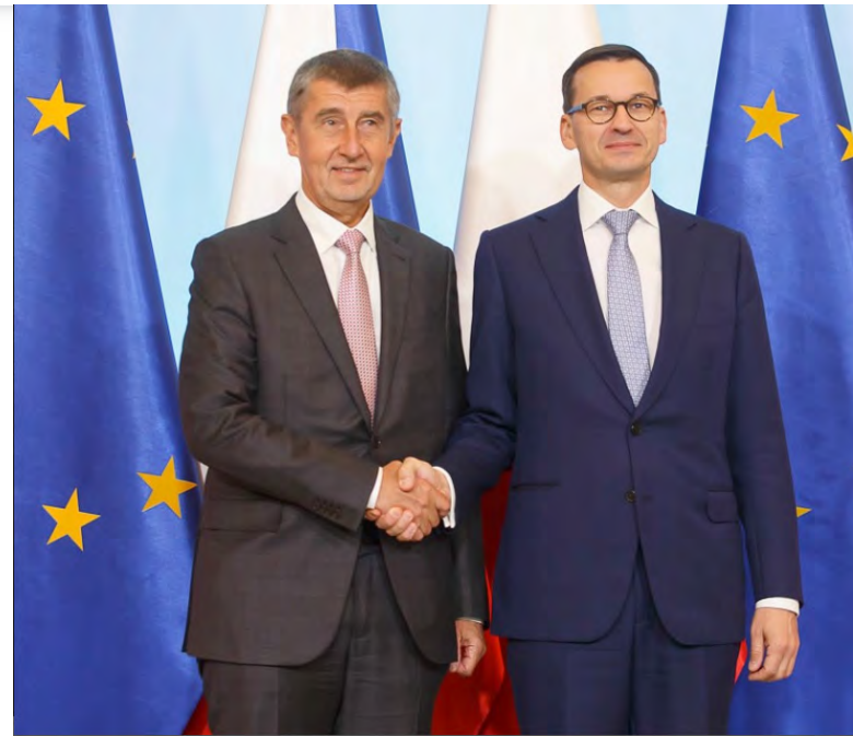
Andrej Babiš se svým polským protějškem, premiérem Mateuszem Morawieckým [1]

Generální advokátka argumentovala tím, že podle rozhodnutí [1] o relokačních kvótách by měly být veřejný pořádek a národní bezpečnost brány v úva-