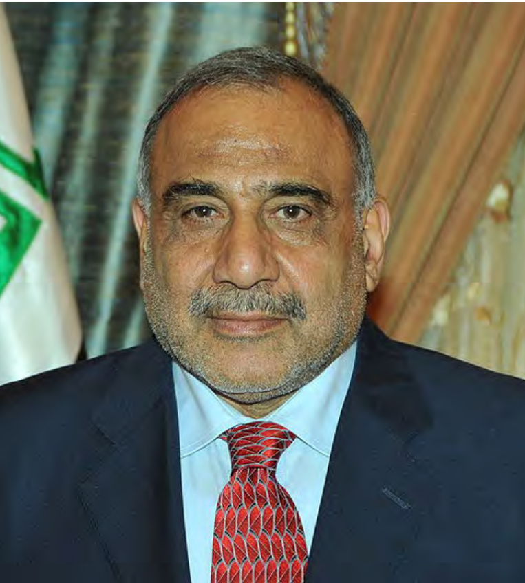
Irácký premiér Ádil Abdal Mahdí [2]

do tzv. Zelené zóny, v níž se nachází vládní budovy i zastupitelské úřady.