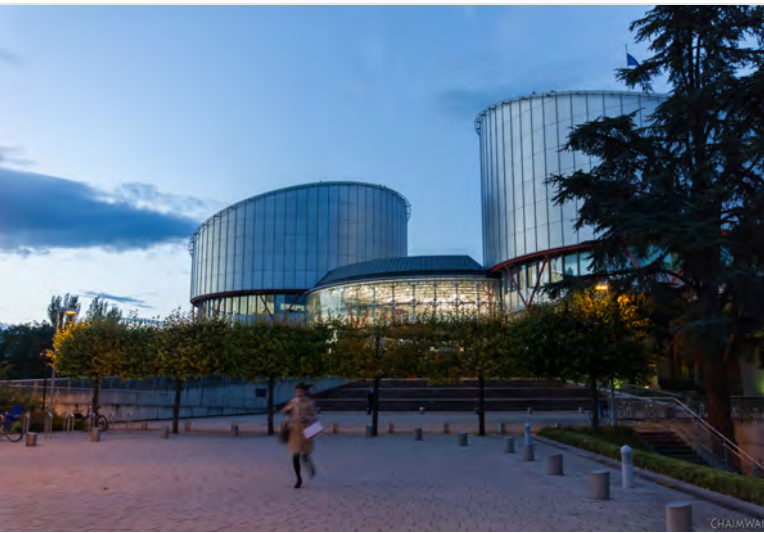
Budova Evropského soudu pro lidská práva ve Štrasburku [2]