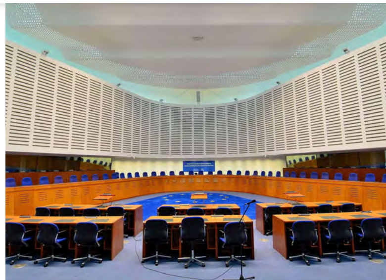
Soudní síň Evropského soudu pro lidská práva [1]

V roce 2012 opatrovník stěžovatele požádal státní zastupitelství o opětovné zhodnocení uloženého trestu. Nově provedené zdravotní zprávy mimo jiné uváděly, že stěžovatel byl ve zkoumané době stabilní, několik měsíců nepožil omamné látky a jeho chování nevykazovalo takové známky