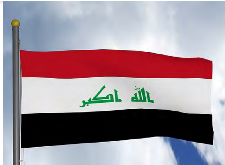
Irácká vlajka [1]

Frustrovaní Iráčané se již několik týdnů bouří nejen proti žalostné ekonomické situaci, ale také sektářskému politickému systému, jenž dle jejich přesvědčení přispívá k nárůstu korupce a klientelismu v politických řadách. Konkrétně pak kritizují princip známý pod označením „Muhasasa ta'ifia“, spočívající v obsazování vládních pozic na