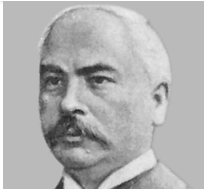
Fjodor Fjodorovič Martens [3]

Academic EPublisher, Brussels, ISBN 978-82-93081-96-8. First published on 12 December 2014. str. 373