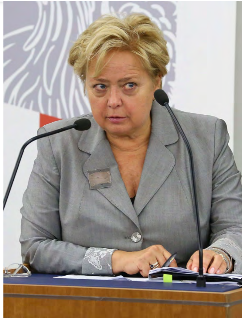
Malgorzata Gersdorf [2]

let a soudkyním na 60 let, coby odporující zákazu diskriminace na základě pohlaví. Polský argument, že tímto postupem sledoval pouze vyrovnání podmínek pro jinak znevýhodněnou skupinu obyvatel, tedy pro ženy, dle Soudu neobstál, neboť je naopak spíše poškozoval. Soudkyním bylo totiž upřeno právo na rovný přístup k práci a rovnou mzdu.