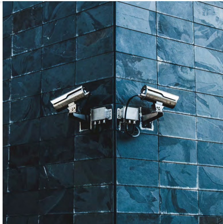
Dohledový kamerový systém [1]

Ačkoliv tajemno spojené s technologickým pokrokem ve vědě fascinuje lidstvo po staletí (a je zdrojem četných uměleckých děl od Frankensteina a Čapkova R.U.R. až po kultovní filmy Vesmírnou odyseu a Blade Runner ), současný překotný vývoj již tolik prostoru pro poetiku nenabízí. Zdá se totiž, že lidstvo se některým filmovým scénářům přibližuje až nepříjemně blízko či je dokonce překonává. Jak by asi dnes Orwell reagoval při zjištění, že existuje propracovaný systém kamerového sledování a automatizovaného rozpoznávání obličejů stovek milionů lidí v největším státě světa, na němž je založeno jejich sociální bodové hodnocení, a tím do značné míry předurčen jejich další osud?