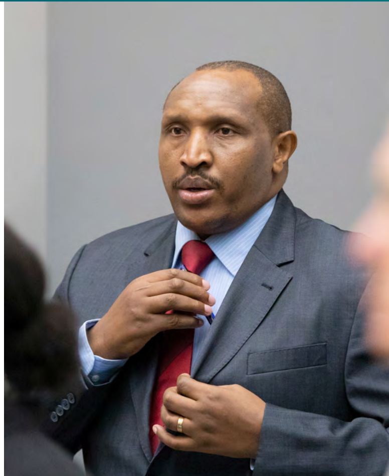
Bosco Ntaganda [1]

Ntagandova výpověď před soudem celkem trvala šest týdnů. Obžalovaný v jejím průběhu popřel veškerá obvinění a sám sebe označil za „revolucionáře, nikoliv kriminálního“. Proces s Ntagandou dopro-