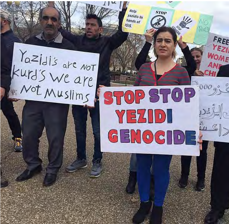
Protestující za ukončení genocidy [2]

postupem ISIS vůči jezídům – eliminace jejich identity a skupiny jako takové.