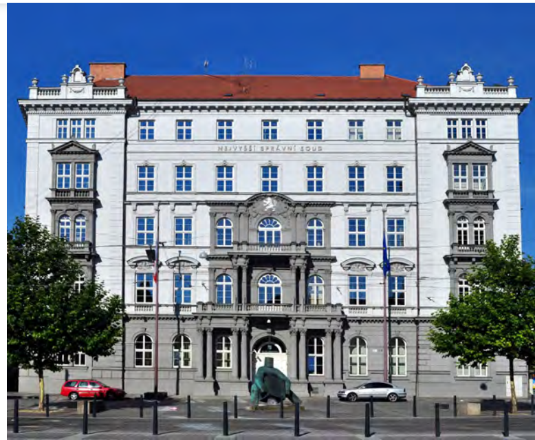
Nejvyšší správní soud ČR [1]

První posouzení práce uchazeče přichází již ze strany habilitační komise, která v rámci tajného hlasování vyjadřuje svůj názor k tomu, zda má být uchazeč doporučen vědecké radě ke jmenování docentem, anebo naopak doporučí předmětné řízení zastavit. V případě, že předseda komise uchazeče ke jmenování doporučí, skládá se dále řízení z tzv. habilitační přednášky a obhajoby habilitační práce, která se koná na veřejném zasedání vědecké rady. Následuje rozprava, v níž má uchazeč prostor vyjádřit se k posudkům, vypracovaným třemi oponenty, jež jsou jmenováni habilitační komisí. Pro zajištění jejich co nejvyšší objektivity smí pouze jeden z oponentů být z vysoké školy, na níž se řízení koná. V rámci této diskuze může uchazeč