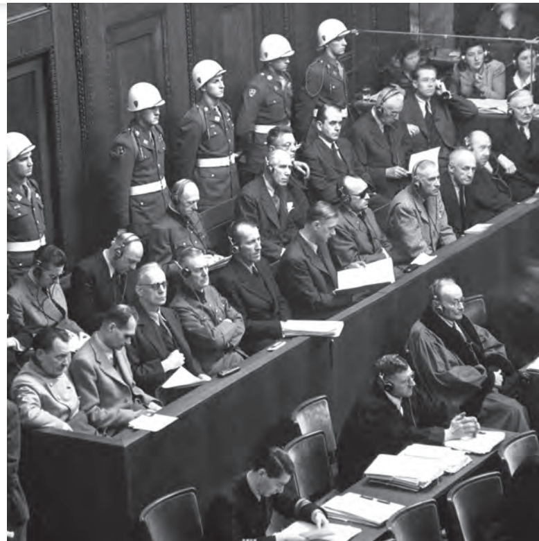
Norimberské procesy [1]

Římský statut Mezinárodního trestního soudu (MTS), z něž návrh Úmluvy vychází, nabízí nej-