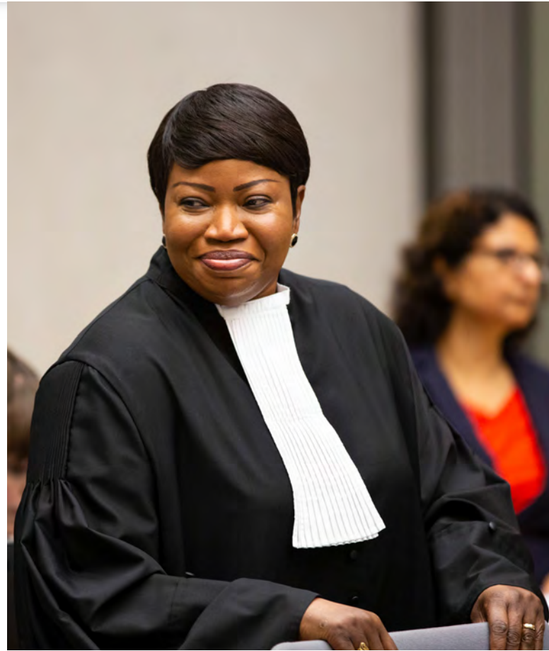
Prokurátorka MTS Fatou Bensouda [4]