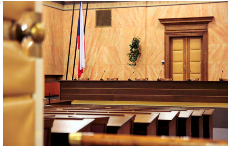
Budova Ústavního soudu České republiky [4]

vy jako trestného činu, a pokud dojde k použití prostředků trestního práva, pak by se mělo jednat pouze o nejzávažnější případy.[2]