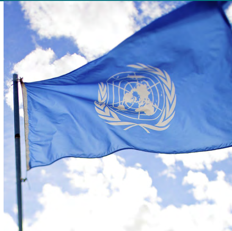
Vlajka OSN [1]

Výbor na úvod kvituje některé pozitivní kroky, které Česká republika ve sledovaném období učinila. Jsou jimi odstranění vepřína na místě bývalého