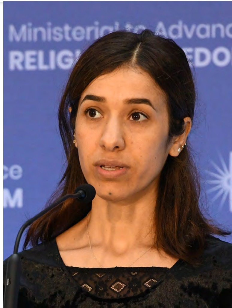
Nadia Murad [1]

Proces prodeje lidí byl zastřešován a zprostředkován ISIS a probíhal převážně na internetu. Takto prodané ženy a děvčata byly degradované na status věci, která po koupi patřila svému „majiteli“, jenž si s ní mohl dělat co chce. Prodaná osoba ztratila v očích ISIS a jejich zákonů jakékoli práva a celá její existence se odvíjela výsostně od jejího „majitele“. Mnoho jezídů bylo nucených k domácím pracím,