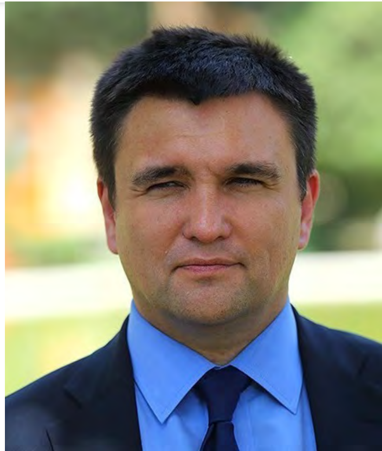
Ukrajinský ministr zahraničí Pavlo Kimkin [2]

nutí obyvatele Krymského poloostrova k vojenské službě. Podle ruského práva je vyhýbání se vojenské službě trestným činem, za který hrozí finanční pokuta nebo trest odnětí svobody v délce až dvou let. HRW analyzovala celkem 71 případů, ve kterých krymské trestní soudy mezi roky 2017 a 2019 posuzovaly trestný čin vyhýbání se výkonu vojenské služby. V 63 případech byli obvinění shledáni vinnými, a z toho důvodu byli nuceni zaplatit pokuty ve výši od 5 000 do 60 000 rublů (v převodu až 22 000 Kč).