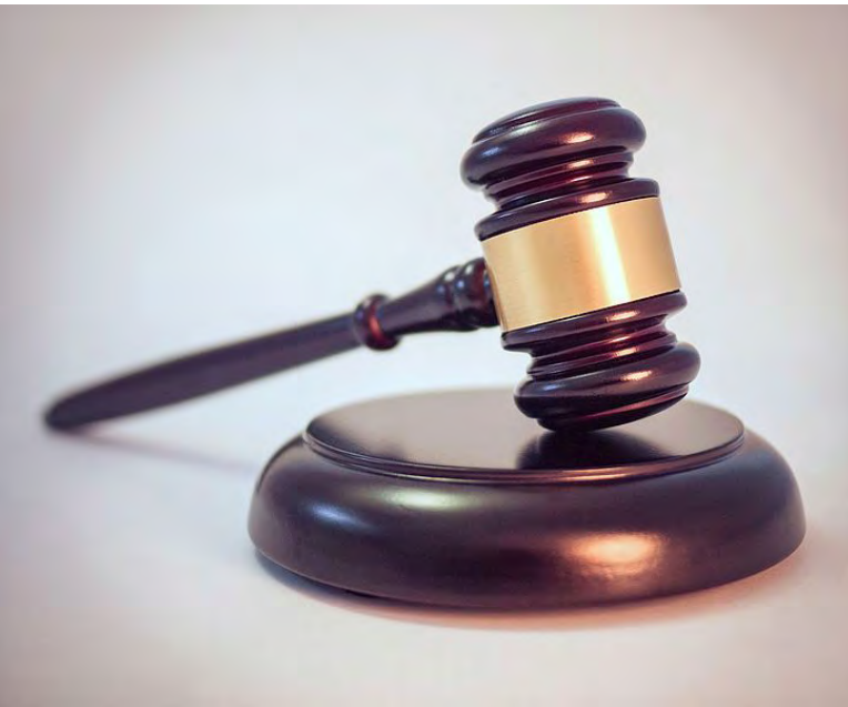
Ilustrační foto [2]

ba vykládat tak, aby byl brán zřetel na jejich rozsah. Zásah do výsledků obhajoby disertační práce či následné zneplatnění vykonání státní závěrečné zkoušky má být prostředkem ultima ratio . Zpětný postih má nastat dle důvodové zprávy jen tehdy „šlo-li o úmyslné jednání proti dobrým mravům systematické povahy nebo byla-li u dotyčného podstatně narušena možnost získat standardní znalosti a dovednosti absolventa daného studijního programu“.