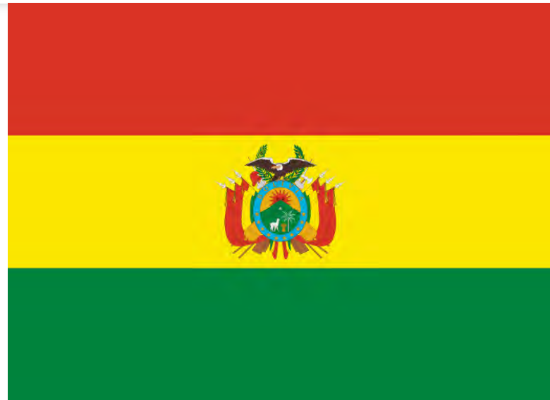
Bolivijská státní vlajka [4]

du s mezinárodněprávními normami upravujícími použití síly z hlediska dodržování lidských práv.