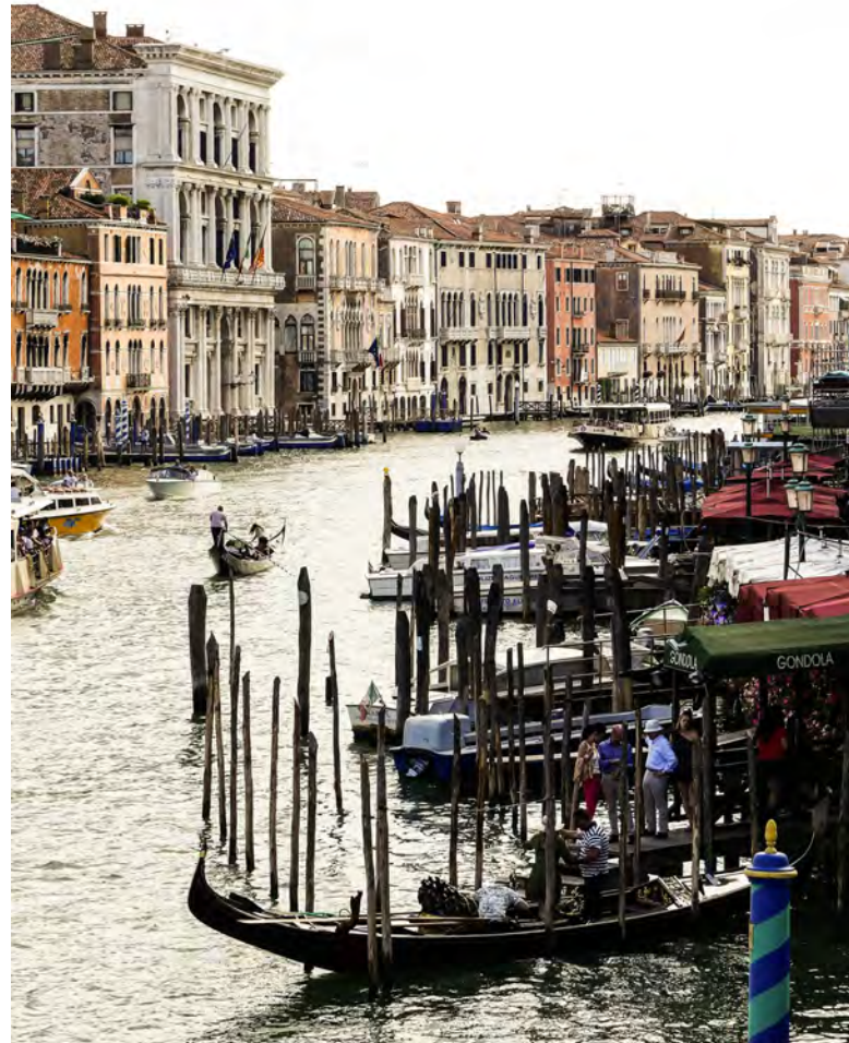
Evropská komise pro demokracii prostřednictvím práva tradičně zasedala v italských Benátkách [1]

Istanbulská úmluva, přesněji řečeno Úmluva o prevenci a potírání násilí vůči ženám a domácího násilí, vyvolává v posledním období vyhrcovanou debatu v řadě států Evropy. Vedle České republiky mezi ně patří též Arménie, jejíž současná vláda označila ratifikaci instrumentu za jeden ze svých politických cílů. Mezi hlavní námitky, jež jsou proti ratifikaci vznášeny, se řadí potenciální rozpor Istanbulské úmluvy s Ústavou Arménie. O posouzení oprávněnosti této námitky požádala Arménie Benátskou komisi. Stanovisko (Opinion No. 961/2019) dospělo k závěru, že námitka není oprávněná a že i když posouzení kompatibility Istanbulské úmluvy a Ústavy Arménie je v konečné fázi věci Ústavního soudu, Benátská komise „je toho názoru, že v úmluvě nejsou žádná ustanovení, o nichž by bylo možno říci, že odporují Ústavě Arménie“ (§ 116). Coby expertní právní orgán přítom Benátská komise nezaujala žádné stanovisko k tomu, zda by Arménie měla nebo neměla