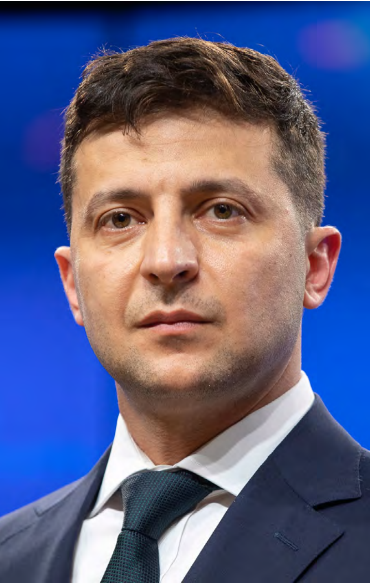
Prezident Ukrajiny Volodymyr Zelenskyy [3]

však zpřísněním legislativy nekončí. Ruské orgány přihlášené k odvodu propagují v krymských městech a na tamních základních a středních školách.