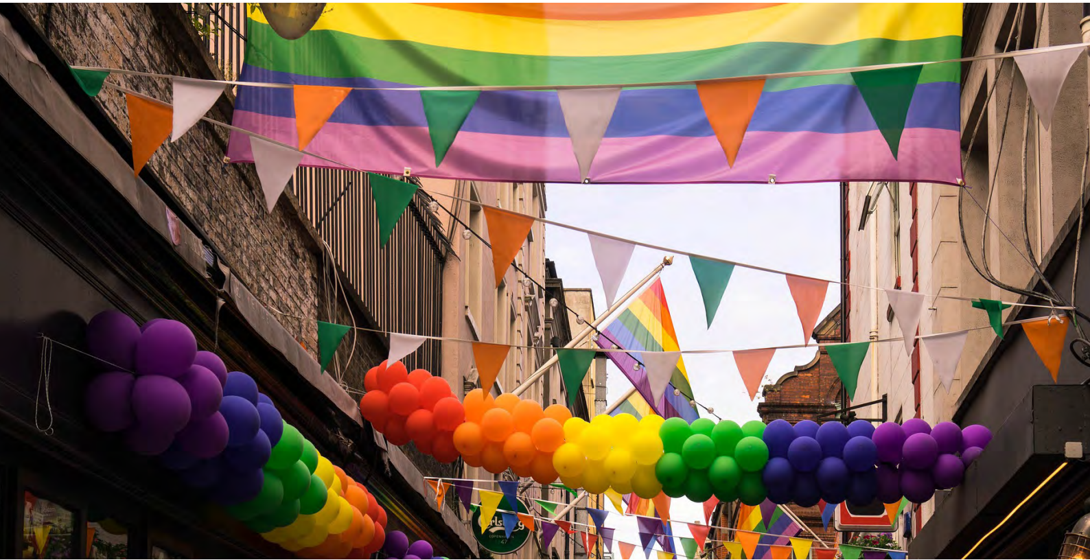
Ilustrační foto [5]

pertů proti násilí vůči ženám a domácímu násilí). Tento orgán má mít nestandardně široké kompetence, v důsledku čehož by jeho aktivity mohly zasahovat do suverenity států. Zvláštní výhrady budí vymezení výsad a imunit členů GREVIO, které je obsaženo v samostatné příloze v úmluvě. Výsady a imunity zahrnují mj. zákaz zatčení či zadržení, vynětí z trestní jurisdikce či vynětí z omezení týkajících se svobody pohybu. Stanovisko konstatuje, že na rozsahu kompetencí GREVIO obecně i na okruhu výsad a imunit garantovaných jeho členům není nic neobvyklého. Istanbulska úmluva v tomto kopíruje model, který je znám z jiných lidskoprávních úmluv Rady Evropy. Z hlediska kompetencí není ostatně GREVIO nijak silným orgánem, např. jeho rozhodnutí nemají právně závaznou povahu, tento orgán nemá pravomoc posuzovat individuální stížnosti aj. Neobvykle může působit zakotvení výsad a imunit ve zvláštním protokolu, to je ale motivováno tím, že úmluva je otevřená nečlenskými státním rady Evropy, které nejsou vázány obecnou Úmluvou o výsadách a imunitách Rady Evropy z roku 1949.