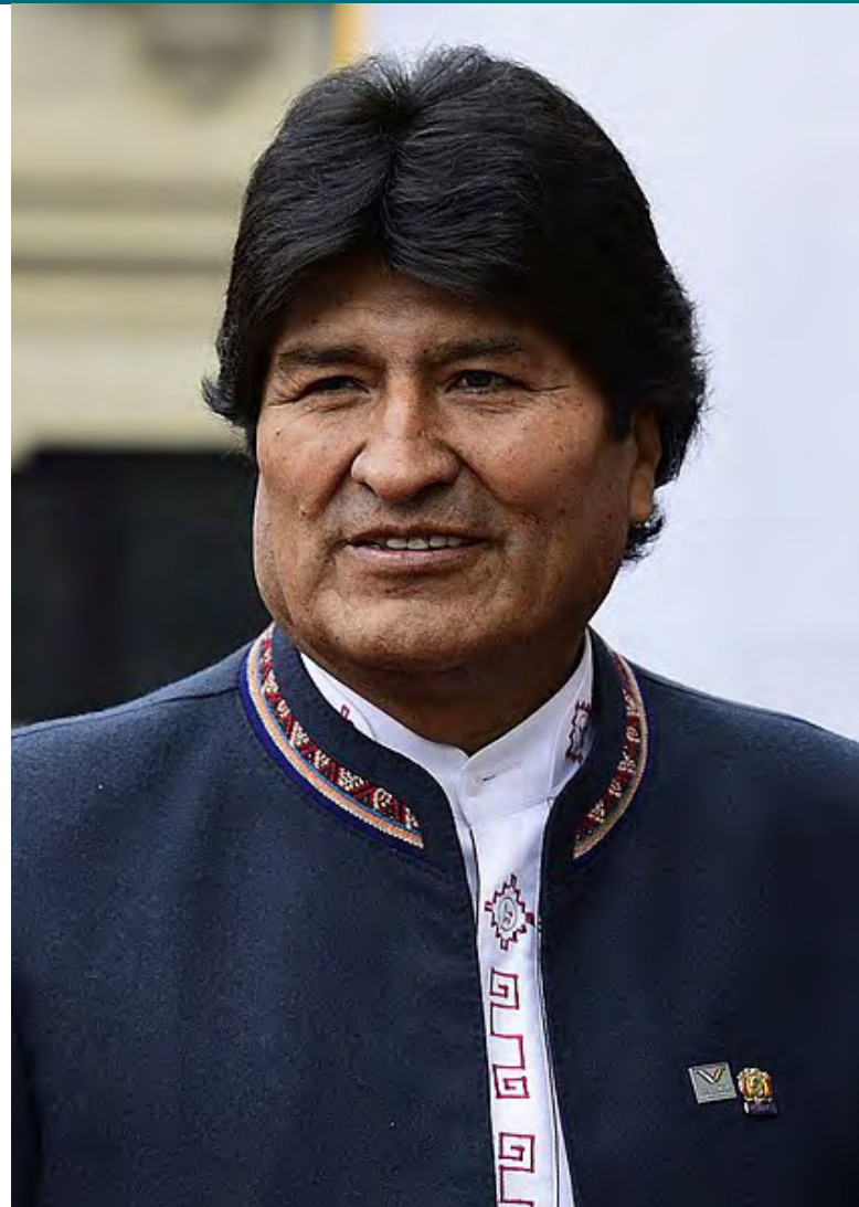
Evo Morales [1]

Dle předvolebních průzkumů se měl Morales stát vítězem voleb, ne však s výrazným rozdílem oproti