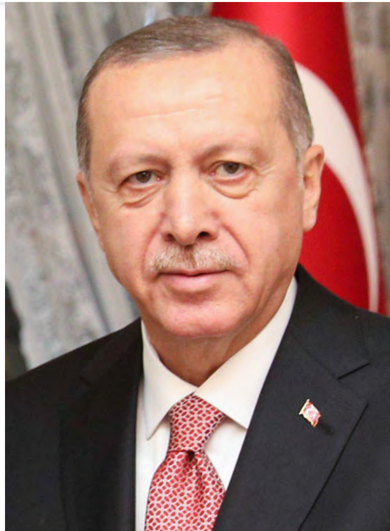
Turecký prezident Recep Tayyip Erdoğan [1]

Právo na sebeobranu zakotvené v čl. 51 Charty OSN je jednou ze dvou výjimek v mezinárodním