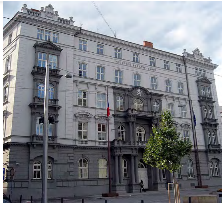
Nejvyšší správní soud [1]

Rektor namítal nesprávnou interpretaci § 47c odst. 2 písm. b) zákona o vysokých školách. Dle jeho názoru nelze zmíněné ustanovení a pojem soustavnosti vykládat natolik extenzivně, aby byl vyvolán