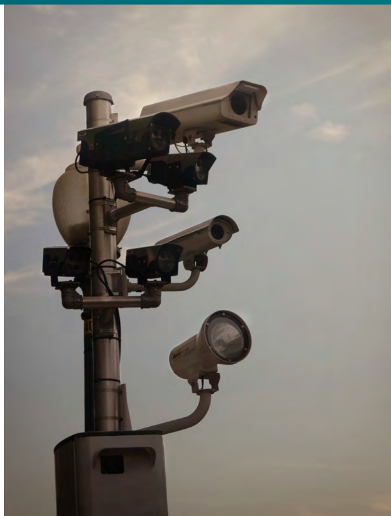
Zaměstnanci někdy mohou být sledováni kamerami [1]

Zatímco stěžovatelé namítali porušení práva na soukromí spočívající ve sledování bez jejich vědomí, španělská vláda tvrdila, že zaměstnanci nemohli legitimně očekávat takovou míru soukromí, pokud se pohybovali ve veřejném prostoru supermarketu