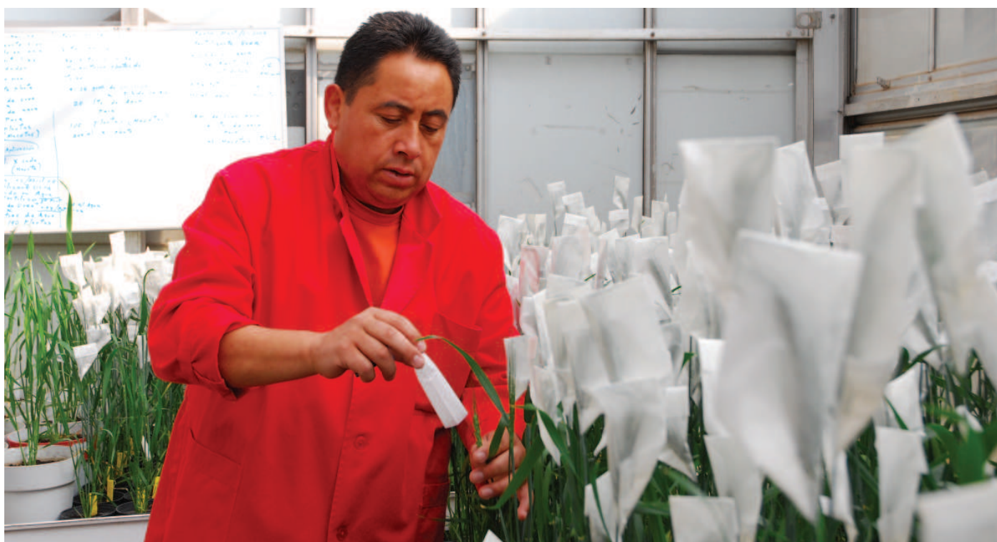
GM pšenice v laboratoři.

Trade Related Intellectual Property Rights. ActionAid. ( http://www.actionaid.org.uk/sites/default/files/doc_lib/53_1_trips.pdf ).