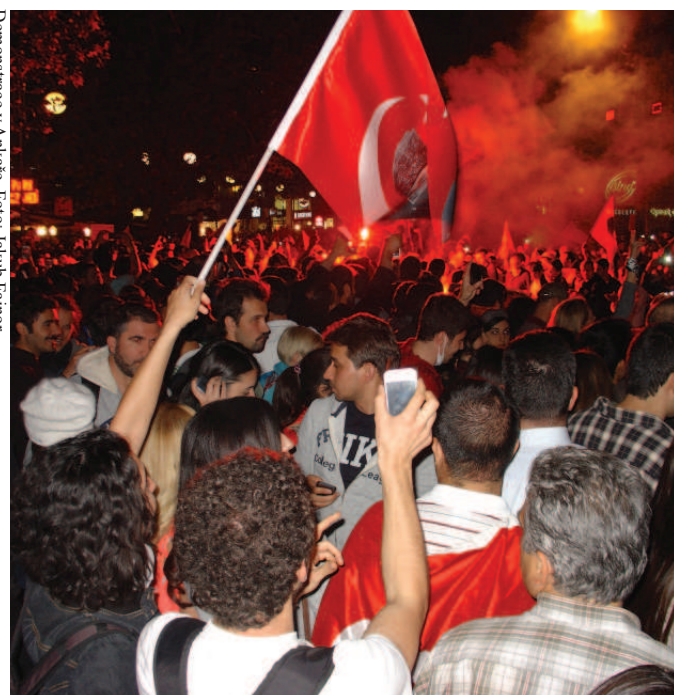
Demonstrace v Ankarě.

Vášnivá povaha Turků a jejich smysl pro solidaritu vzdemuly po celé zemi vlnu nepokojů. Co vypadalo zpočátku jako krátkodobý problém, záhy přerostlo v masivní celonárodní protest. Více než po tři týdny vycházeli lidé ven ze svých domovů, aby vyjádřili svůj názor a nesouhlas s kroky současné vlády konzervativního premiéra. Nejmasivnější protesty se odehrály v hlavním městě Ankarě a největším městě Istanbulu, ve kterých se denně scházely desítky a místy až stovky tisíc lidí vyjadřujících nesouhlas s policejní brutalitou.