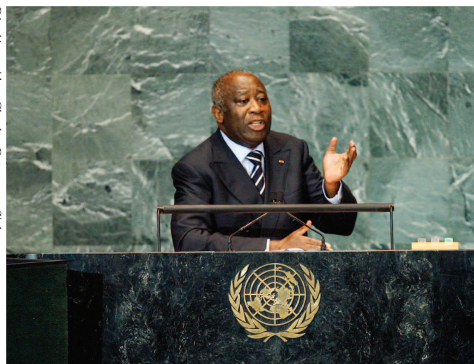
Bývalý prezident Gbagbo.

Pobřeží slonoviny (Côte d'Ivoire), západoafrická země, jež i po konci francouzské koloniální vlády další tři desetiletí hospodářsky vzkvétala, prodělala první převrat v roce 1999. Ačkoli se po něm situaci podařilo poměrně zklidnit, spory ve společnosti nakonec vyvrcholily v roce 2002 konfliktem mezi vládními silami vedenými tehdeším prezidentem Laurentem Gbagbem a povstaleckými skupinami. O rok později byla do Pobřeží slonoviny vyslána mise OSN a s ohledem na další ne-