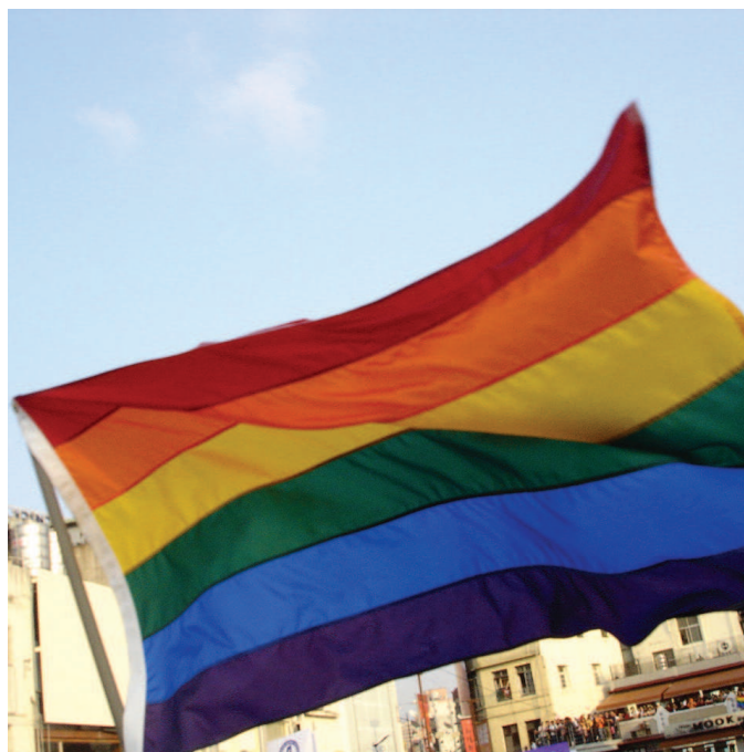
Ilustrace foto.

V obou výše uvedených případech je zde snaha o legalizaci možnosti osvojit si dítě, jehož biologickým rodičem je druhý z registrovaných partnerů. Iniciati-