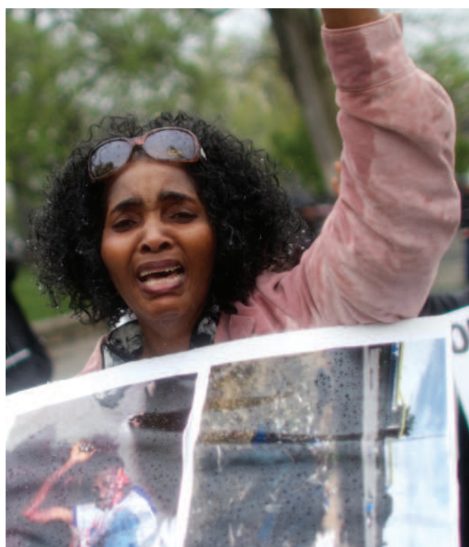
Podporovatelka Laurenta Gbagba.

Právě to se v případě bývalého prezidenta Gbagba zatím příliš nedaří. Přípravný senát MTS totiž 11. června rozhodl o nedostatečnosti důkazů pro zahájení hlavního líčení [2], pro tento závěr se vyslovili dva ze tří soudců senátu. Za problematickou považovali zejména