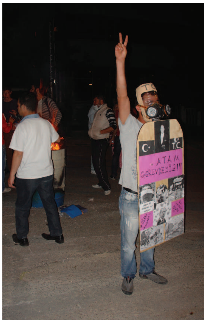
Turecké protesty.

Poslední květnový den letošního roku se stal symbolem revolty nejen mladých lidí proti budoucímu směřování tureckého státu pod vedením premiéra Recepta Tayyipa Erdogana. Fascinující je, že protesty v Turecku nevyústily z nějakého dlouhodobého organizovaného hnutí. Demonstrace proti turecké vládě vzešly spontánně z nesouhlasu s policejní brutalitou, se kterou zasáhly bezpečnostní složky proti poklidné demonstraci cílené proti výstavbě nákupního centra na místě parku Gezi, symbolu centra Istanbulu na náměstí Taksim. Policejní těžkooděnci s pomocí vodních děl, slzného plynu, pepřového spreje a obušků neúměrně tvrdě zasáhli proti skupině environmentalistických nadšenců. Jejich zásah skončil mnohdy až těžkými zraněními. Pro ilustraci: jednu ženu trefil do hlavy projektil slzného plynu a upadla do kómatu.